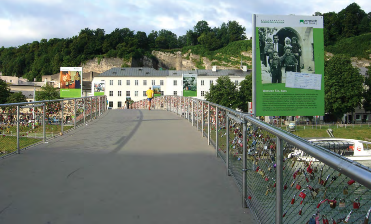
Abb. 4 „Wissensbrücke“ am Makartsteg (23. Mai – 1. Juli 2013) unter dem Motto „Kommen – Gehen – Bleiben. Migrationsstadt Salzburg“

hatten. Wichtig war dabei, sowohl die Zu- wie auch die umfangreichen Abwanderungen aus der Stadt sichtbar zu machen. Neben den Ansiedlungen der römischen und keltischen Bevölkerung im Salzburger Raum, zählten auch die Gründer der Stadt und der Universität zu ZuwanderInnen. In der Geschichte der Stadt Salzburg gab es kaum einen Erzbischof unter den zahlreichen kirchlichen Regenten, der kein Immigrant war. Daneben kam es immer wieder zu Vertreibungen von ethnischen oder religiösen Gruppen wie der jüdischen oder protestantischen Bevölkerung. Eine weitere wichtige Rolle spielten die zahlreichen Arbeitsmigranten, die spätestens seit dem Mittelalter immer wieder für die großen Bauprojekte der Erzbischöfe in die Stadt geholt wurden. Ein Beispiel dafür waren die italienischen Architekten, Künstler und Bauarbeiter, die selbst noch im ausgehenden 19. und frühen 20. Jahrhundert auf den Bauplätzen in Stadt und Land, wie Fotografien zeigen, zu finden waren. Dem wichtigen und vielfach übersehenen Aspekt der weiblichen Migration – und hier insbesondere der Arbeitsmigration von Frauen – wurde ebenfalls in mehreren Tafeln Aufmerksamkeit gewidmet. Insgesamt war es den Gestalterinnen