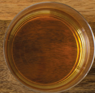
EIN GLAS APFELSAFT