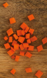
EIN HAUCH VON KAROTTEN