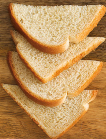
KOHLENHYDRATE, DIE 2 SCHEIBEN WEISSBROT ENTSPRECHEN