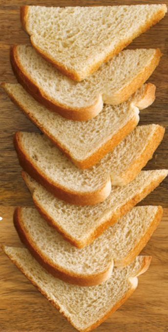
KOHLENHYDRATE, DIE 3 1/2 SCHEIBEN WEISSBROT ENTSPRECHEN

Es gibt noch weit unaussprechlichere Zutaten. Um sie alle hier aufzuzählen, müsste ich ein Chemielehrbuch schreiben. Was diese Suppen nicht enthalten, sind natürliche Lebensmittel. Wie wir als Studentinnen bei unserer Instant-Nudel-Diät überleben konnten, ist mir heute ein Rätsel!