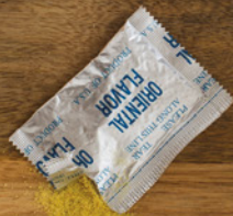
AROMA (SPRICH: CHEMIE)