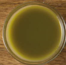
EIN SCHNAPSGLAS GEMÜSESAFT

Falls Sie wirklich entgiften wollten, wären Sie froh um all das, was nach dem »Entsaften« entsorgt wird: Fruchtfleisch, Schalen und Blätter. Diese liefern nämlich den Großteil der wertvollen Faser- und Nährstoffe. So werden die kostbarsten Bestandteile der Nahrung weggeworfen!