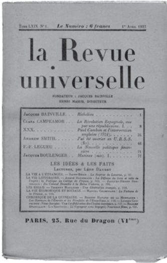
Número de la Revue universelle, con la primera versión de estas memorias