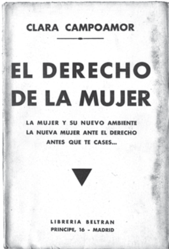
Cubierta de la edición de 1936 de El derecho de la mujer