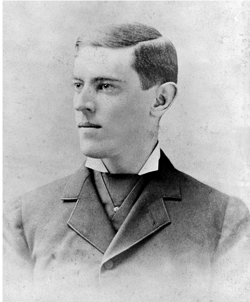
Woodrow Wilson 1879 im Alter von 23 Jahren als Student am College of New Jersey (Princeton).