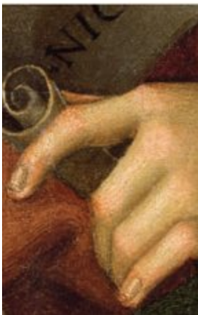
Engel mit Spruchband (Fragment des Baronci-Altarbildes)