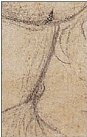
Kopf eines Jungen mit Barett