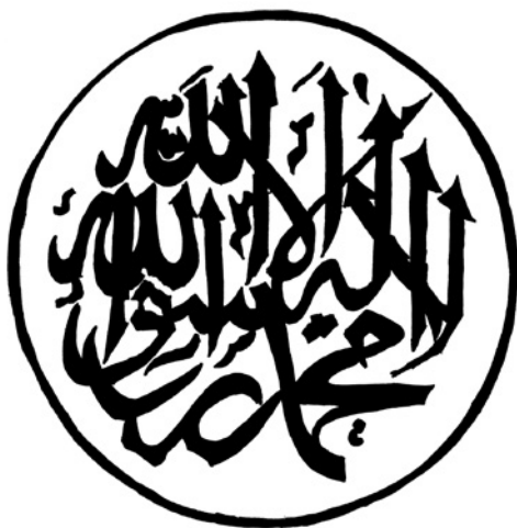
Abbildung 1: Kunstvolle Kalligrafie des islamischen Glaubensbekenntnisses