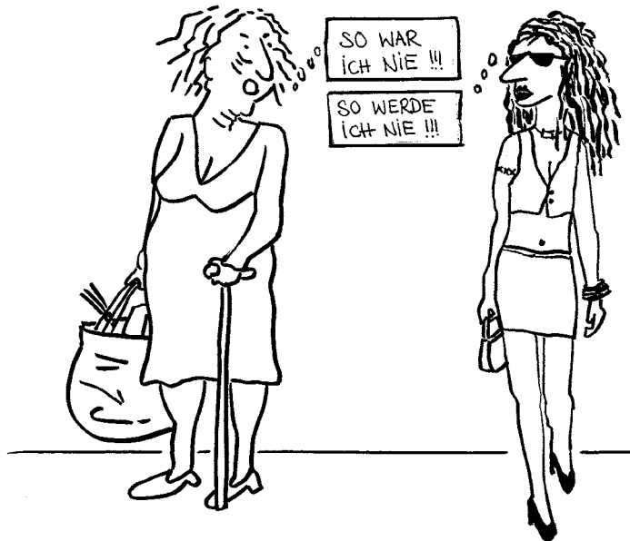
Abbildung 1: So war ich nie ...

„Die verschiedenen Altersstufen der Menschen halten einander für verschiedene Rassen. Alte haben gewöhnlich vergessen, dass sie jung gewesen sind, oder sie vergessen, dass sie alt sind, und Junge begreifen nie, dass sie alt werden können.“