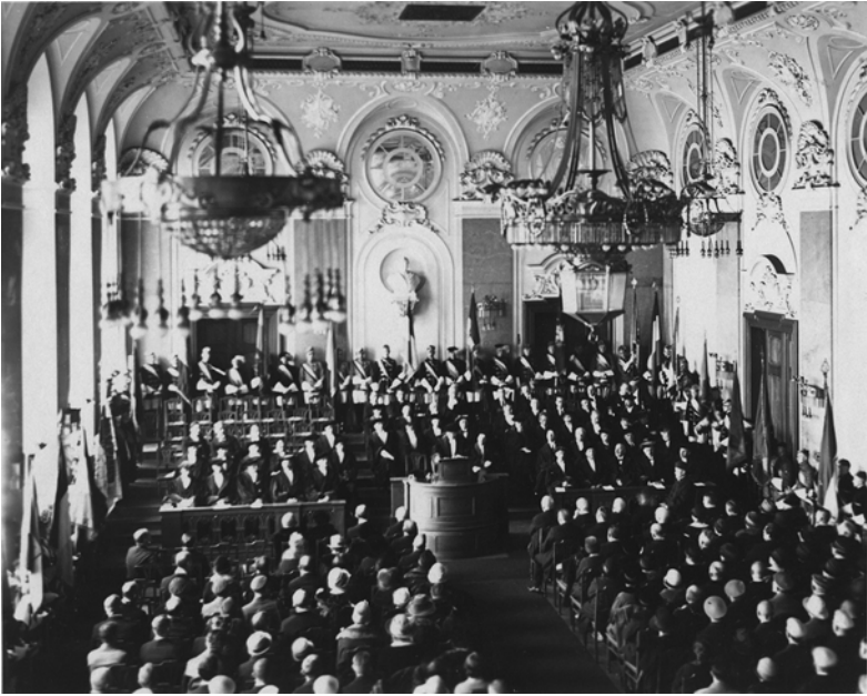
Abb. 1: Eröffnung der Universität Frankfurt im Oktober 1914

ihr nicht vorbeigegangen werden, wenngleich sie, wie in diesem Falle, nur ein notwendiges Beiprodukt blieb.