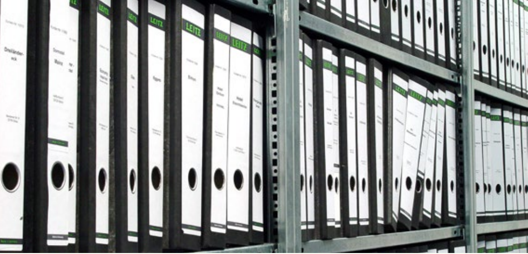
Aktenordner der Firma Leitz

dacht wurde der heute gebräuchliche Ordner im Jahr 1886 von einem Friedrich Soenneken aus Bonn, der auch den zugehörigen Locher erfand. Damit war die Bahn für Leitz bereitet: Seine Erfindung der typischen Aushebe-Mechanik und des Registers ermöglichte ab 1886 das rasche Einordnen einzelner Blätter an jeder gewünschten Stelle eines Aktenstapels. Die Hebelmechanik konnte nicht nur geöffnet und wieder verschlossen, sondern auch arretiert werden. Bis 1896 kamen noch die Raumparschlitz im Einband dazu. Leitz' revolutionäre Mechanik ist bis heute nahezu unverändert in jedem Aktenordner zu finden.