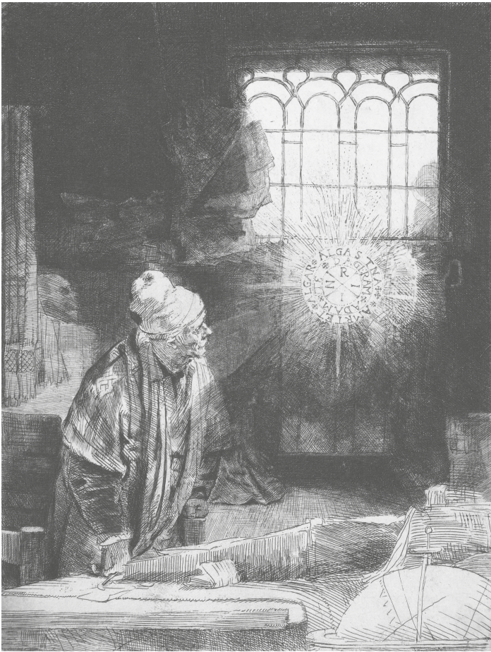
Rembrandt, Faust . Rijksmuseum Amsterdam, um 1652

Man hat in diesen Versen Goethes eigene Stellung zum Worte sehen wollen, wie man ja häufig genug in naiver Weise die Faust-Gestalt mit Goethe zu identifizieren pflegt. Obendrein kommt die Zeitmeinung über das Wesen des Wortes dieser