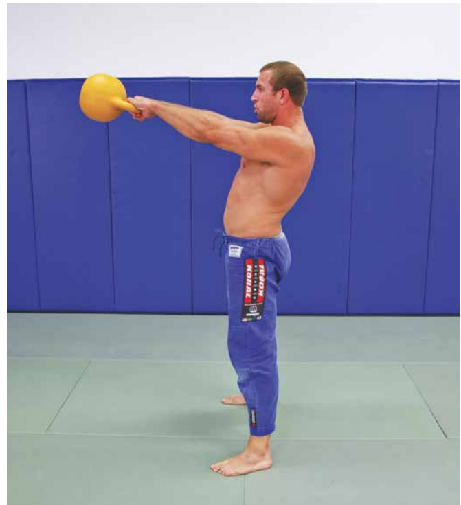
Kugelhanteln sind eine großartige Ergänzung zum Jiu-Jitsu.

Du kannst deinen Lernprozess auch durch die Verwendung von Büchern und Videos beschleunigen. Doch am Ende musst du immer mit einem Partner trainieren, damit sich dein Muskelgedächtnis die Techniken einprägt.