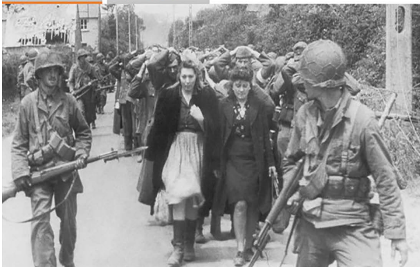
Die Verbrechen der Befreier

US-Soldaten mit Kriegsgefangenen nach der Schlacht von Cherbourg im Juni 1944.