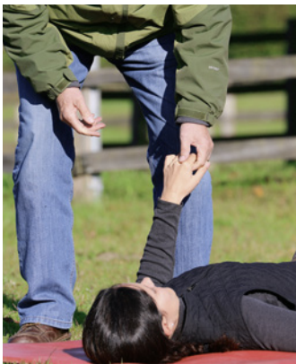
Stimulierung der Faszien

Diese Komplexität von Bewegung (Seite 33) soll anhand von mehreren Sichtweisen dargestellt werden, damit transparent wird, dass sich Bewegungen von außen und innen betrachten lassen. Nur die Verwobenheit beider Sichtweisen macht es möglich, dass ein Ausbilder den Reiter und auch der Reiter sich selbst in seiner Spezifik zu erfassen vermag. Grundlegende Aspekte von anatomischen (Seite 49) und physiologischen Bedingungen (Seite 62) des Reiters werden abgehandelt und in Bezug zu Reitabläufen gesetzt. Anatomische und physiologische Kenntnisse können Reitprobleme in ihrer Komplexität alleine nicht