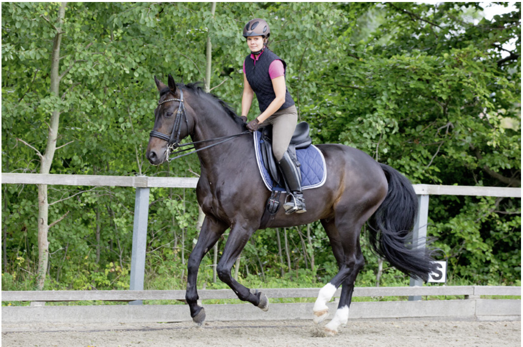
Der Blick der Reiterin leitet die Wendung ein. Es gilt die Regel: Der Kopf führt und der Körper folgt.