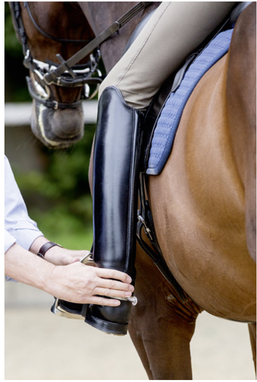
... und verbessern das korrekte Treiben.