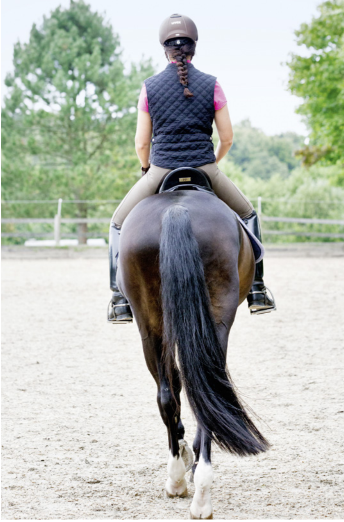
Lernen soll nicht ohne die Mitbestimmung des Schülers stattfinden, um ihn handlungsfähig werden zu lassen.