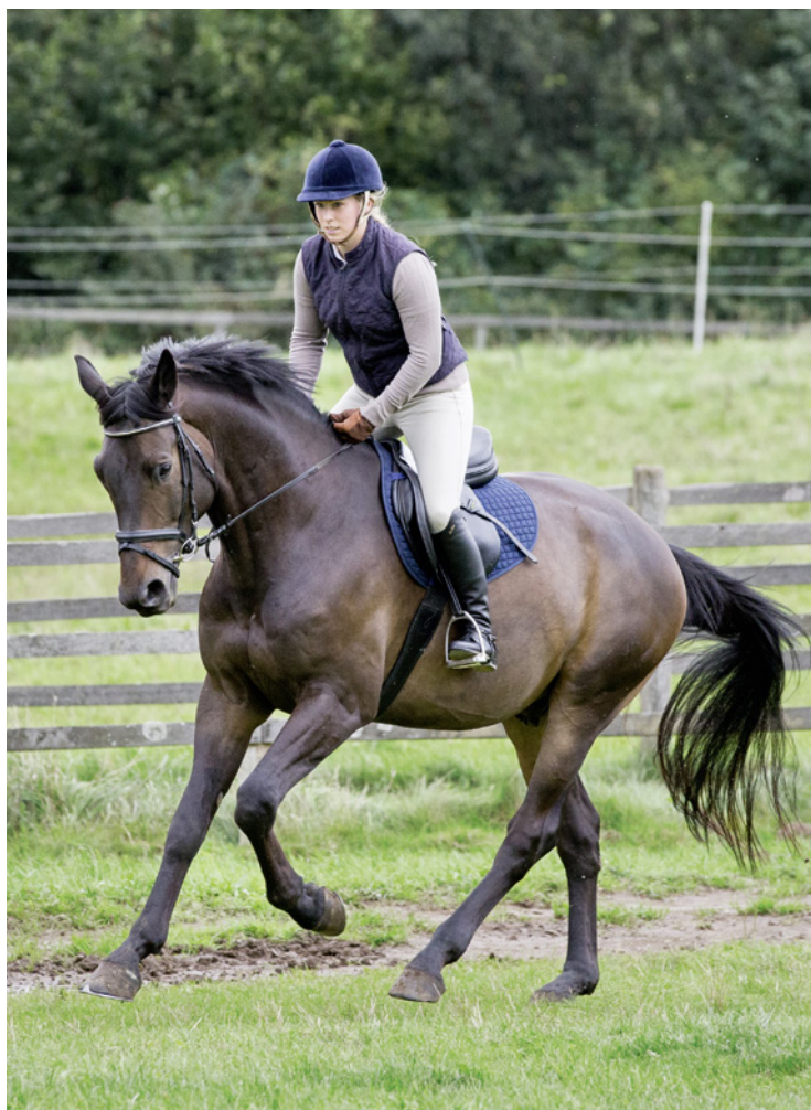
... von Reiter und Pferd.

gehend von den augenblicklichen Mängeln müssen Reitlehrer in Kooperation mit dem Reiter versuchen, methodisch andere Wege mit eventuell auch anderen Lektionen einzuschlagen (Vermittlungsebene). Je nach Bewegungssituation steht die Sache (Reit- und Bewegungslehre), die Beziehung (zwischen Ausbilder und Reiter) oder die Variation der Vermittlung (Methode) im Mittelpunkt des Geschehens. Es kann also auch durchaus vorkommen, dass der Ausbilder kurzfristig zu Anweisungen greift, um dem Pferd und auch Reiter eine Lektion zu vermitteln.