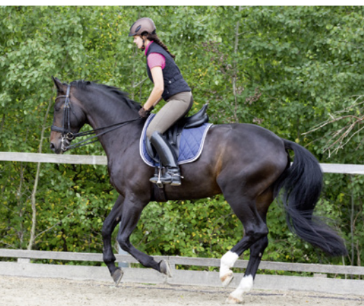
... führen zur besseren Beweglichkeit ...