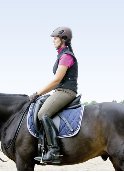
Reiterliche Fehlhaltungen führen zu unerwünschter Steifheit. Ein Rundrücken ...