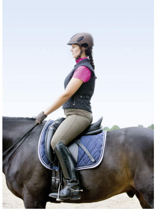
... oder ein Hohlkreuz wirken sich ungünstig auf die Beckenstellung des Reiters aus.

sulziert aus Schwächen in der Planung. Ausbilder müssen sich bemühen, die innere Planung des Reiters so intensiv wie möglich zu unterstützen. Dem Reiter muss Zeit gegeben werden, um sich planerisch nach den Aufgaben des Reitlehrers innerlich zu organisieren.