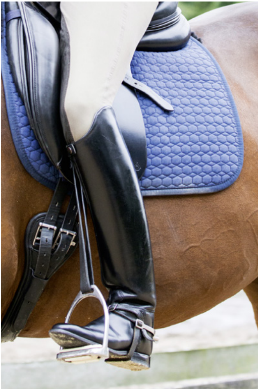
Taktile Hilfen sensibilisieren das Bewegungsgefühl...