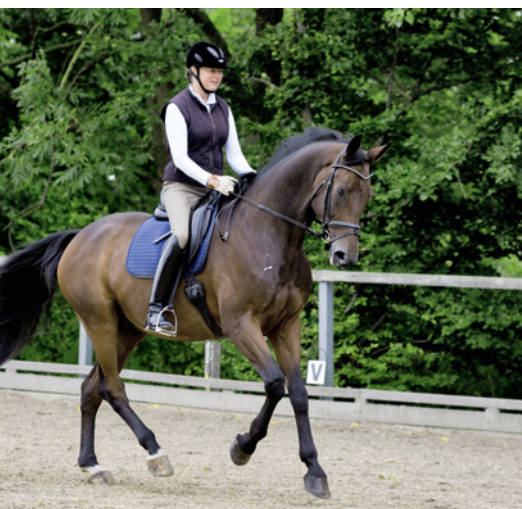
Unterschiedliche Sitzformen im Galopp ...