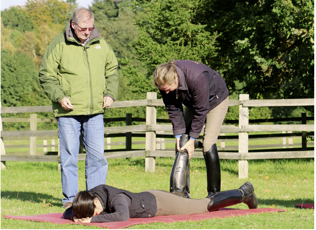
Unterricht als Zusammenspiel von Schülerin, Reitlehrerin und Bewegungstrainer.

transparent machen. Deshalb bilden äußere und innere Bewegungszusammenhänge von Reitproblemen die notwendige Konsequenz (Seite 79).