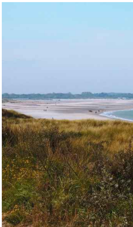
☒ Der wunderschöne Banjaardstrand auf der Insel Noord-Beveland

Die im Zuge des Deltawerkes angelegten Dämme haben auch bewirkt, dass die Strände der Provinzen Noord-Holland, Zuid-Holland und Zeeland leichter zu erreichen sind. Viele Strände sind so weitläufig, dass sie jedem Urlauber genau das bieten, was er sich wünscht. Eine perfekte Infrastruktur gibt es nahe der