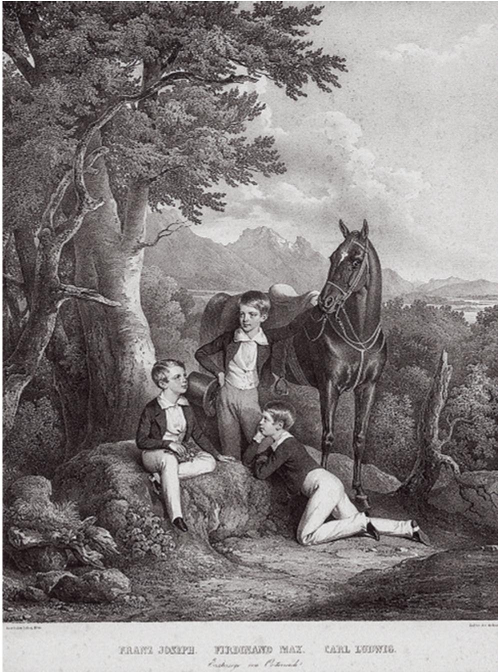
[2] Die Erzherzoge Franz Joseph, Ferdinand Max und Karl Ludwig, Lithographie von Joseph Kriehuber, 1844