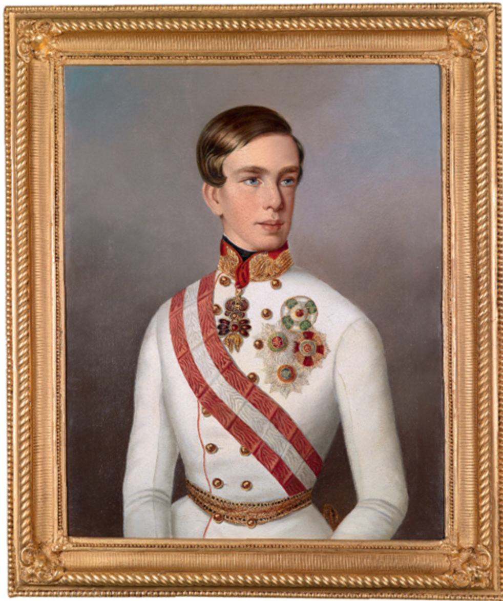
[5] Kaiser Franz Joseph, Porträt des jungen Kaisers in Uniform mit Ordenschmuck, Gemälde, um 1849

5 Als im Zuge der bürgerlichen Revolution 1848 absehbar wurde, dass mit dem schwachen und kranken Kaiser Ferdinand für die Monarchie ernsthafte Gefahr bestand, war Sophies Stunde gekommen. Da bald deutlich war, dass der Kaiser werden ab danken müssen, und auch Franz Josephs Vater, Franz Karl, nicht die Persönlichkeit war, der man die nötige Intelligenz, Tatkraft und das