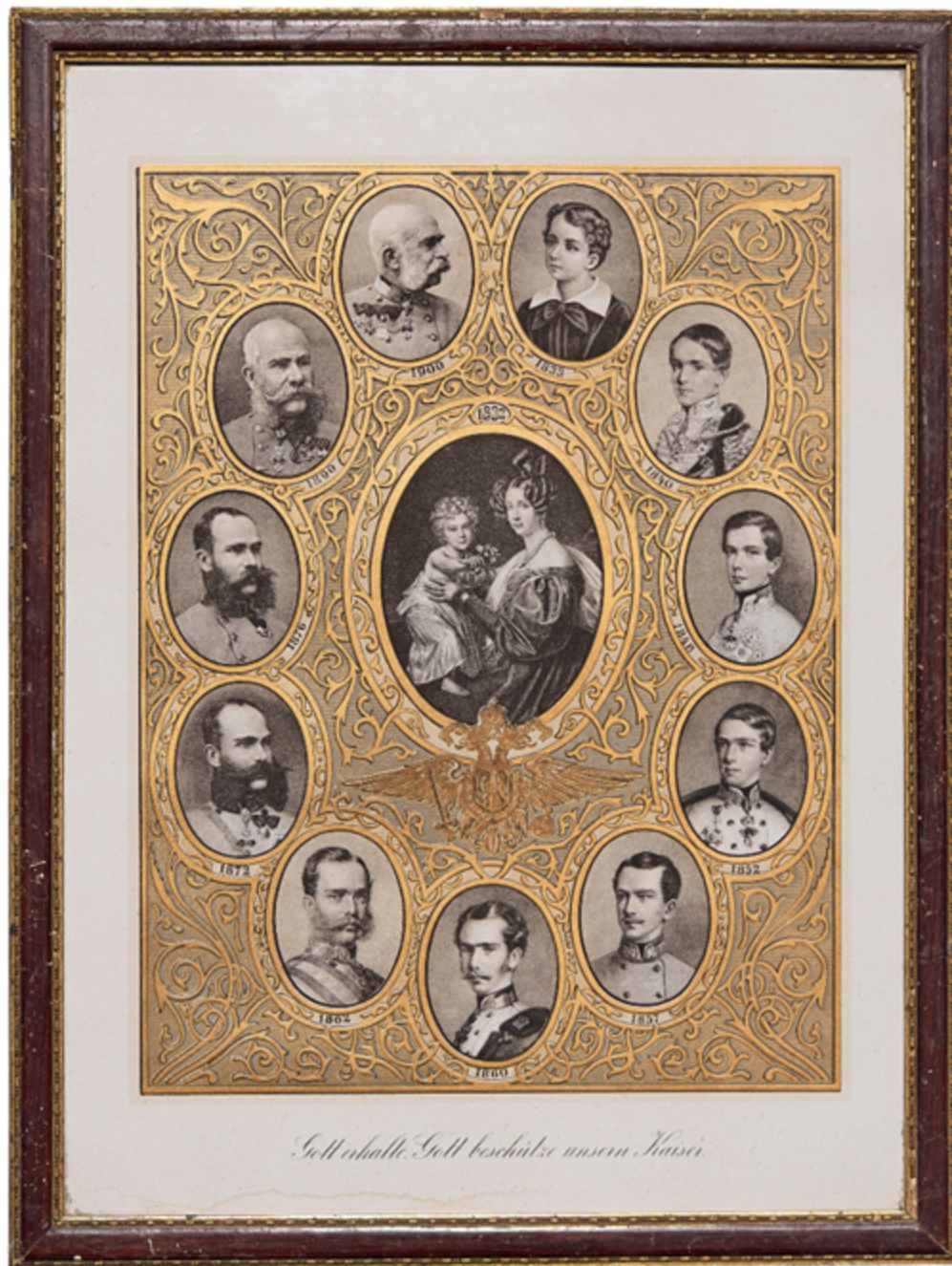
Darstellung Kaiser Franz Josephs in verschiedenen Lebensaltern von ca. 1833 bis 1916. Bildnismedaillons um die zentrale Darstellung seiner Mutter Erzherzogin Sophie mit dem kleinen Erzherzog, nach dem Gemälde von Joseph Stieler gruppiert. Bezeichnet mit »Gott erhalte Gott beschütze unsern Kaiser«, um 1916