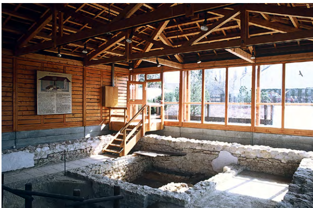
Ein römisches Gewerbegebäude in Großprüfening bei Regensburg