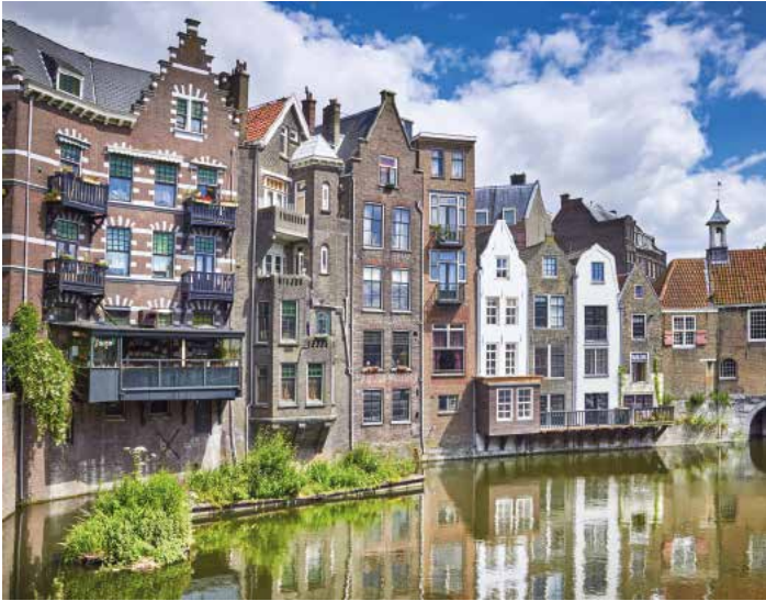
146rd Abb.: ©acnateksy, stock.adobe.com