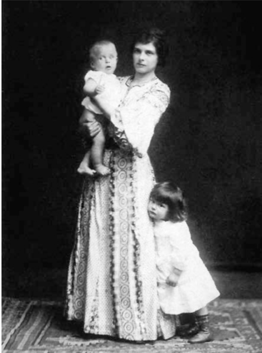
Katia Mann mit Klaus und Erika, um 1907

Ein halbes Jahr später, nach der Geburt von Klaus am 18. November 1906, dürfte es in ihm kaum anders ausgesehen haben: Er führt ein Leben gegen den Strich. Auch Katia dürfte sich nicht ohne Reibungsverluste auf die Rituale eines Schriftstellerhaushaltes, ihre Pflichten als Mutter und Zuarbeiterin eingestellt haben, denn zum Leidwesen ihres Mannes schafft sie sich mit maliziösen Wendungen, Ironie und „Scherzen“ Luft.