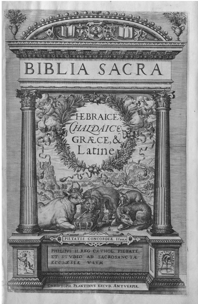
Abb. 2: Eines der berühmtesten Druckwerke des 16. Jahrhunderts: die Polyglotte aus der Officina Plantiniana in Antwerpen: Biblia Sacra Hebraice, Chaldaice, Graece, & Latine. Tomus I–VIII, Antwerpen: Christophorus Plantin, 1567–1572 (UB Leipzig, St. Thomas.19:1).