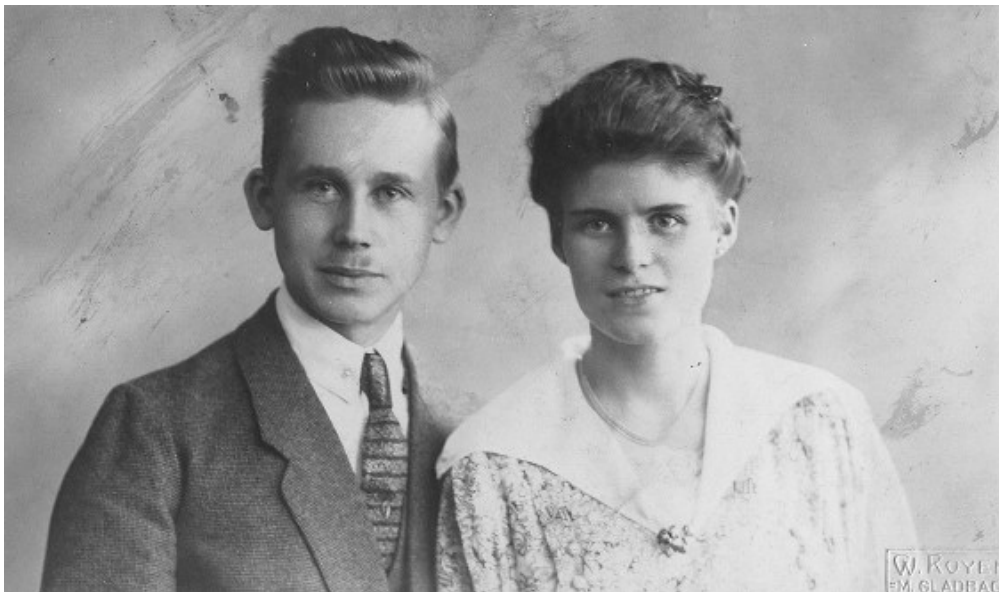
Vater und Mutter frisch verlobt (1919).

Mein Elternhaus hatte drei Etagen. Auf der ersten wohnten wir, die Hausbesitzer. Wir hatten dort eine geräumige Wohnung, die um vieles tiefer als breit war.