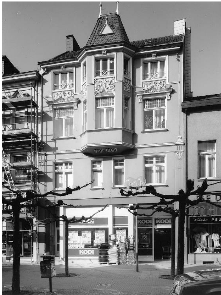
1869er Fassade an der Hauptstraße meiner kleinen Stadt.

Unsere Hauptstraße, die mit zahlreichen Geschäften, mit Restaurants, Cafés, einer Bank und einer Sparkasse ihren Namen zu Recht trug, war die wirtschaftliche Lebensader meiner kleinen Stadt. Besonders an Wochentagen war sie quicklebendig.