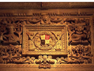
Un relieve de gran detalle de finales del siglo XVI en el museo de Vitré

A inicios del siglo XX se construyó el actual ayuntamiento. Este edificio está constituido por un imponente châtelet –un pequeño castillo con dos torreones que defienden la puerta levadiza– y otros seis torreones, de entre los cua-