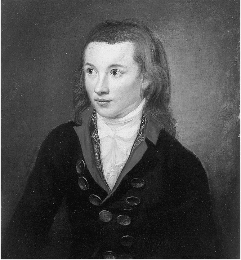
Friedrich von Hardenberg. Gemälde eines unbekanntes Künstlers (um 1790)

hin authentisch dieses Gemälde als das Bildnis Friedrich von Hardenbergs.