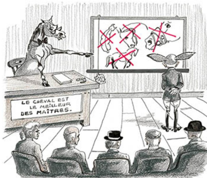
Das Pferd ist der beste aller Lehrmeister.