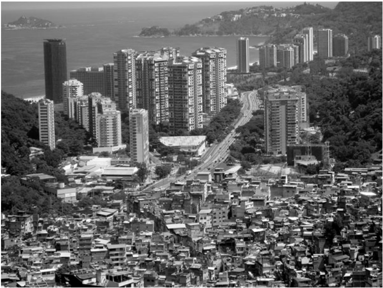
Abb. 1.2 Das Bild einer heutigen brasilianischen Großstadt illustriert den Wettlauf zwischen der Bevölkerungszunahme, die zur Verarmung und dem Entstehen von Slums führt (unten im Bild), und dem Wirt-

schaftsaufschwung der Industriegesellschaft, die akzeptablen Wohnraum schaffen kann (oben im Bild) (Quelle: Rocinha Favela, fotografiert von Alicia Nijdam 2008).