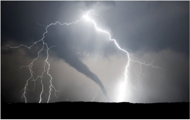
Abb. 1.1 Eine außer Kontrolle geratene Klimaerwärmung könnte zu immer heftigeren Extremereignissen führen. Es wird unerträglich heiß, Stürme peitschen die

Landschaft. Die Menschen werden abwechselnd von Dürren und Überschwemmungen heimgesucht.