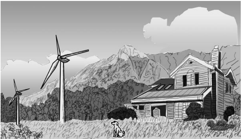
Abb. 1.3 Zukunftsvision eines Lebens in Harmonie mit der Natur in einer fast unberührten Landschaft. Autobahnen und Industrierwerke gibt es nicht mehr.

schaftsaufschwung der Industriegesellschaft, die akzeptablen Wohnraum schaffen kann (oben im Bild).