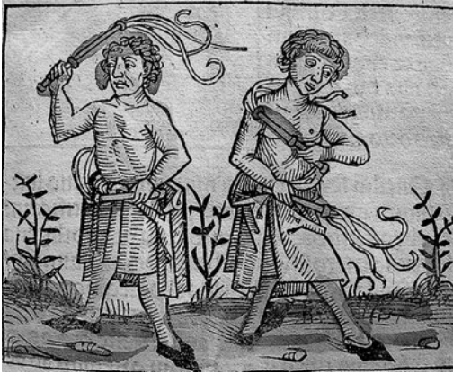
Abb. 1.5 Mittelalterliche Darstellung der Flagellanten, die durch Büßen die Pest bekämpfen wollten (Quelle: Flagellanten. Holzschnitt, 1493, Schedel'sche Weltchronik, Blatt CCXVr.).

der Kernenergie, dem Fracking, dem Artensterben, den Nanopartikeln oder der Handystrahlung wie in Deutschland. Die deutschen Medien sind Weltmeister im Verbreiten von Horrorszenarien [2]. Aber Angst ist ein schlechter Ratgeber, wenn es um die Lösung ernster Probleme geht.