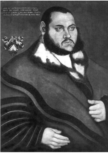
Abb. 1.6 Johannes Carion (1499–1537). Er war einer der ersten Gelehrten, der auf der Basis einer physikalisch richtigen Überlegung eine Katastrophe vorhersagte. Allerdings hatte er sich um den Faktor 1000 verrechnet und die Katastrophe blieb aus (Bildnis von Lucas Cranach dem Älteren (1472–1553) um etwa 1530; Gemäldegalerie Berlin).

den in einer Reihe und verstärkten so die Springflut, die an diesem Tag ohnehin drohte. Die Politik in Berlin glaubte ihm: