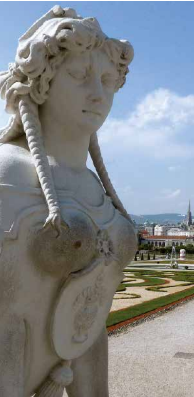
008w1 Abb.: dk

☒ Sphingen wachen über das Obere Belvedere (s.S. 57)