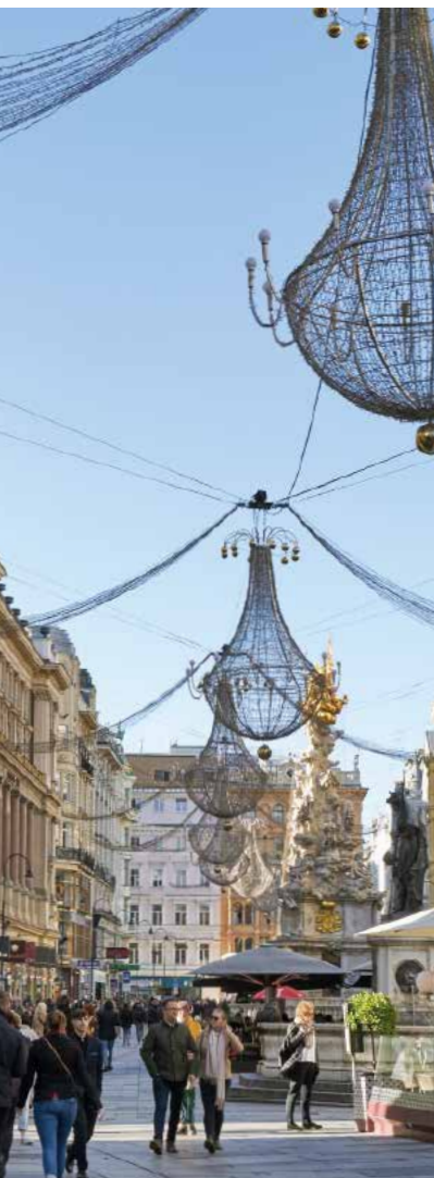
14 Iww Abb.: mw