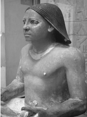
Abb: Schreiber.

Eigensinn zu oder entgegen. Alle elementaren Rücksichtslosigkeiten gegenüber diesem zentralen subjektiv-objektiven Netz führen zu STEUERUNGSVERLUSTEN, im Extremfall zur ENTGLEISUNG.