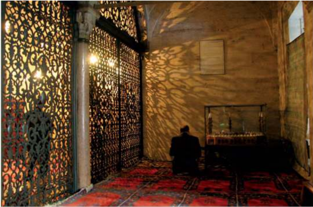
Gläubiger beim Gebet in der Sultan Süleyman-Moschee.