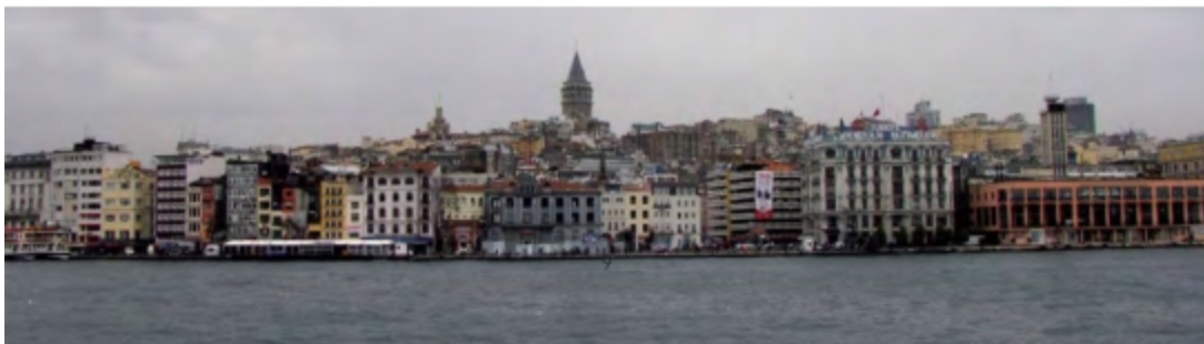
Antike und Moderne, Tradition und Kommerz – Gegensätze die Istanbul einzigartig machen.

hinter dem sich ein ebenso vielschichtiger Charakter verbirgt. Jedes Zeitalter hat seine typischen Erscheinungen, jeder Herrscher prägt durch seine Art der Herrschaft, jede Generation hinterlässt ihre Spuren. Mal sind diese sichtbar, mal bleiben sie verborgen und manchmal werden sie wiederentdeckt. Diese Spuren sind es, die zweieinhalb Jahrtausende Istanbul ausmachen, und in den heute noch oder wieder sichtbaren Spuren spiegelt sich die bewegte Geschichte jener Stadt wider, die auch als »Stadt mit drei Namen«, als »Stadt dreier Weltreiche«, als »Stadt auf zwei Kontinenten« oder als »das Neue Rom« umschrieben wurde und wird und sich nun über eine weitere, offizielle Bezeichnung freuen darf: »Europäische Kulturhauptstadt 2010«.