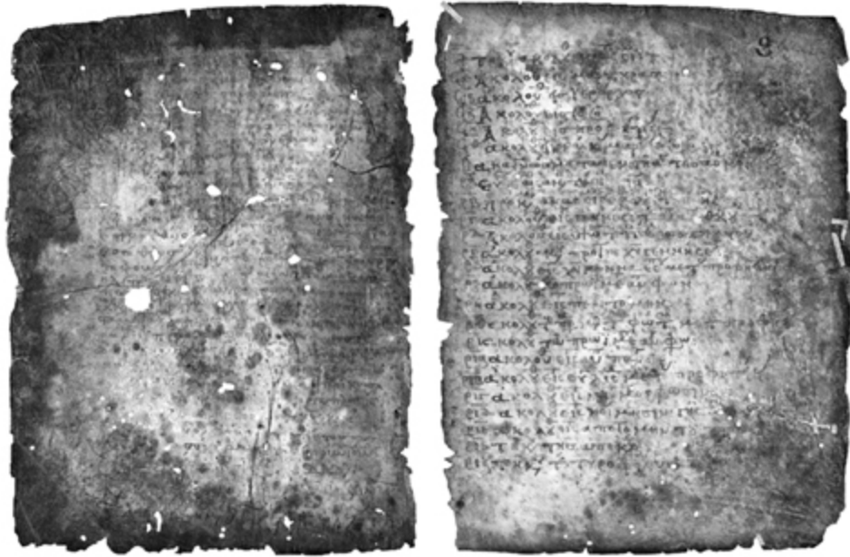
Mittelalterliches Gebetbuch und mathematische Abhandlung. Aufgeschlagene Doppelseite des von Johannes Myronas geschriebenen Euchologion, Archimedes Palimpsest, 10. und 13. Jahrhundert, Privatbesitz

Doch wie sah solch ein Skriptorium eigentlich aus? Wo befanden sich die Werkstatträume? Welche Arbeiten wurden überhaupt im Skriptorium verrichtet? Welche Materialien und Werkzeuge brauchte man, um ein Buch im Mittelalter herzustellen? Haben Schreiber wie Myronas alles selbst gemacht, oder waren noch andere Personen beteiligt? Wer malte die Initialen aus? Wer entwarf das Layout? Farben, Pergament, Einbände - wo kamen die Rohmaterialien her und wer verarbeitete sie? Schrieben und malten auch Nonnen Bücher? Wo wurden mittelalterliche Bücher außerhalb des Klosters hergestellt? Dies sind einige der Fragen, die in diesem Buch beantwortet werden sollen. Im Mittelpunkt steht die Herstellung bemalter oder „illuminierter“ Handschriften im mittelalterlichen Europa.