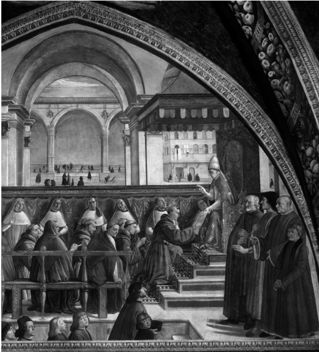
Abb. 1 Ausschnitt aus Domenico Ghirlandaios Die Bestätigung der Regel des hl. Franziskus . Auf der Treppe ist Poliziano zu sehen, der zu dem schwarzhaarigen Lorenzo emporblickt.

Obwohl all diese Elemente in unsere Geschichte einfließen, kann ich auf keines davon ausführlicher eingehen. Von großer Relevanz ist allerdings, in welchem hohem Maße Politik das gesamte Leben in Florenz durchdrang und nicht zuletzt die Kultur beeinflusste. So bestand eine ständige Wechselbeziehung mit dem