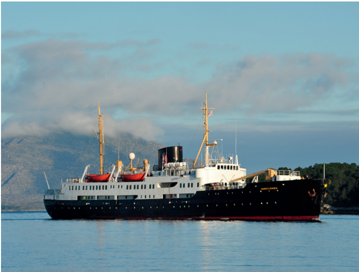
Von 1956 bis 2012 auf Hurtigruten unterwegs: MS Nordstjernen.

Doch damit war der Höhepunkt überschritten, Hurtigruten geriet in Konkurrenz zum Straßen- und Flugverkehr. Die Passagierzahlen sanken