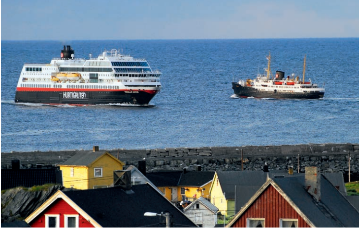
Alt und neu: Die Trollfjord von 2002 trifft die Nordstjernen von 1956.

1993 betrat mit der Kong Harald das erste Schiff der neuen Generation die Bühne – gerade noch rechtzeitig zum 100. Geburtstag von Hurtigruten. Das Schiff wurde auf der Volkswerft Stralsund gebaut, wo auch die anschließend ausgelieferten Schwesterschiffe Richard With und Nordlys entstanden. Neun neue Schiffe wurden zwischen 1993 und 2003 in Dienst gestellt. Die letzten waren Trollfjord und Midnatsol 2002 und 2003, die durch den gläsernen Aufzug in der Schiffsmittle und die dop-