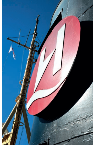
H wie Hurtigruten am Schornstein.

Die drei neuen Schiffe, die Anfang der 1980er-Jahre in Dienst gestellt wurden, waren noch ganz dem Transportgedanken verhaftet. Bei den älteren Schiffen musste die Fracht per Ladebaum gelöscht werden; vier Autos fanden auf dem Vordeck Platz, wo sie dem ultimativen Salztest unterzogen wurden – das war nicht mehr