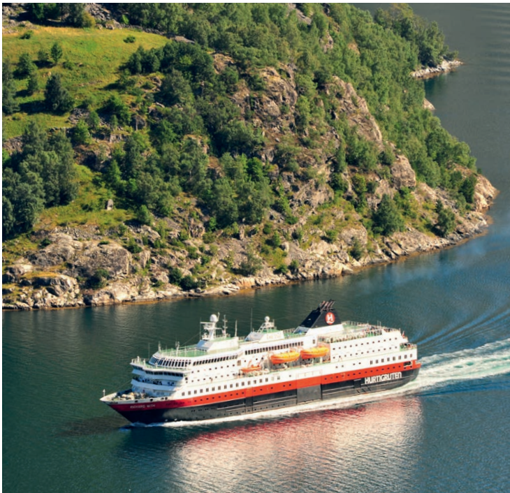
Willkommen an Bord von Hurtigruten.

Einer der Beinamen dieser Linienverbindung war »Reichsstraße Nummer 1«. Man stelle sich die Zeit um