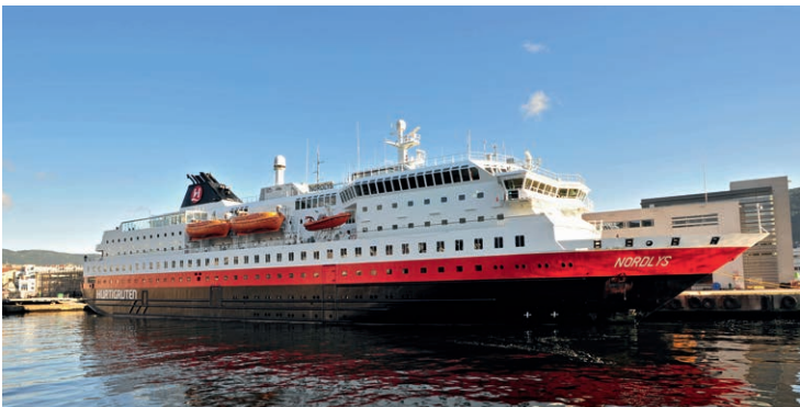
In Bergen beginnt und endet die Rundreise entlang der Küste.

pelstöckigen Panoramasalons durchaus Kreuzfahrtambiente bieten. Hurtigruten benötigt für die täglichen Abfahrten ab Bergen elf Schiffe, sodass die Vesterålen von 1983 und die Lofoten von 1964 weiterhin im Liniendienst sind. Mehrfach ausgemustert, kehrte auch die Nordstjernen von 1956 bis 2012 regelmäßig zurück, zuletzt als Ablöser für die vercharterte Finnmarken . Derzeit ist die Lofoten von 1964 das älteste Schiff, das noch auf Hurtigruten unterwegs ist.