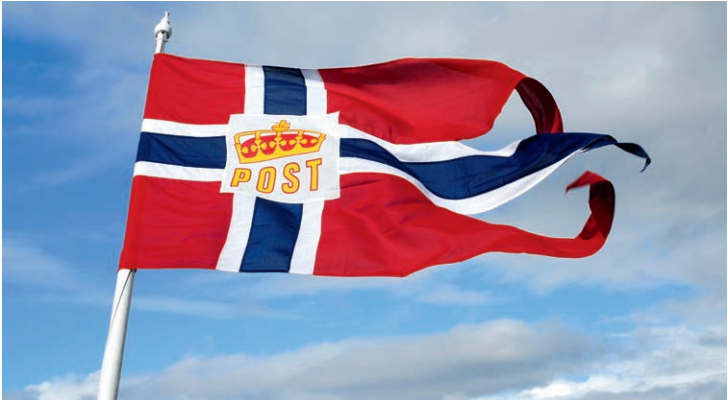
Bis heute weht die norwegische Postflagge am Heck.

skab erhielt, doch dieses Mal begann die Strecke in Bergen und nicht in Trondheim, wie bei den anderen Verträgen. Ende des 19. Jahrhunderts gab es drei verschiedene Hurtigruten: von Bergen nach Hammerfest, von Trondheim nach Hammerfest und die sogenannte Finnmarks-Hurtigruten zweimal wöchentlich von Hammerfest nach Vadsø. Das war in der damaligen Zeit nicht ungewöhnlich: Det Bergenske Dampskibsselskab und Det Nordenfjeldske Dampskibsselskab betrieben im staatlichen Auftrag insgesamt sechs Postrouten, darunter auch die Stammroute von Hamburg über Kristiansand, Bergen, Trondheim und Hammerfest nach Vadsø. Aber diese Schiffe fuhren langsamer, fielen also nicht unter den Begriff Hurtigruten.