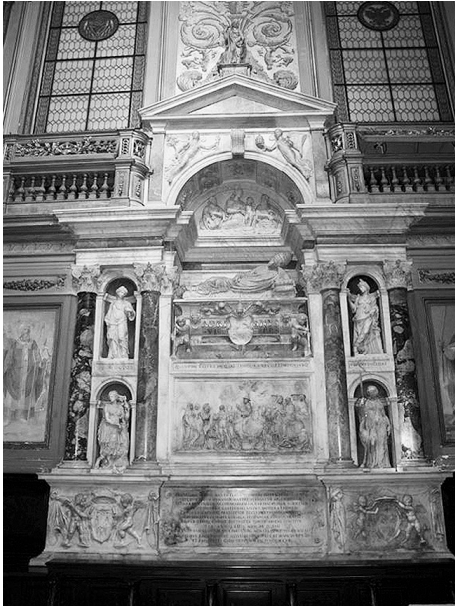
Abb. 1: Grabdenkmal für Papst Hadrian VI. († 1522).