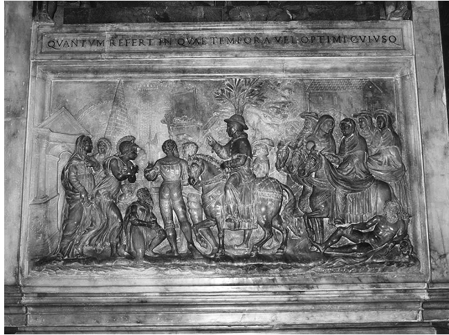
Abb. 3: Grabdenkmal für Papst Hadrian VI. († 1522) (Detail).

In der zurückgesetzten Mittelnische befindet sich unten ein quereckiges Relief mit der Darstellung des Einzuges Hadrians in Rom (Abb. 3): Die Mitte des Reliefs nimmt der auf einem reich geschmückten Pferd in die Stadt reitende Papst ein, bekleidet mit Chorrock und Mozetta, Camauro und Hut, die Rechte segnend erhoben. Hinter ihm ist sein aus Beamten und geistlichen Würdenträgern 16 zu Pferd sowie Hellebardenträgern zu Fuß bestehendes Gefolge zu sehen, vor ihm zwei ihn geleitende, Vortragekreuz und Hellebarde tragende Landsknechte. Empfangen wird Hadrian von einem knienden, bärtigen Mann – dem Senator Roms – und von einer antikisch bekleideten Frau – der Personifikation der Stadt Rom –, die von drei weiblichen Personen und einem Kind begleitet wird. Den Hintergrund der Szene bilden zivile und kirchliche Bauwerke der Stadt, im Einzelnen (von links nach rechts) ein offenes Stadttor, das durch die dahinter liegende Aurelianische Mauer und der Cestius-Pyramide leicht mit der damaligen Porta Ostiensis (und heutigen Porta di San Paolo)