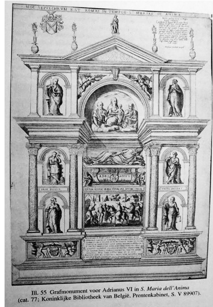
Abb. 2: Grabdenkmal für Papst Hadrian VI. († 1522), Kupferstich von Nicolai van Aelst, aus dem Jahre 1591 (Repro s. wie Anm. 14).

elfzeiligen Grabinschrift ein, während die beiden leicht vortretenden Seitenteile mit zwei gleichen, von Engelsputten gehaltenen Vollwappen geschmückt sind. Sie zeigen mit den drei Adlern 15 erstaunlicherweise nicht das Wappen des verstorbenen Papstes, sondern aus guten Gründen das des Kardinals Wilhelm Enckenvoirt (Willem van Enckenvoirt). Darüber erhebt sich ein hohes Geschoss mit vier Halbsäulen, das aus einer erhöhten rundbogigen Mittelnische und zwei schmälere zweigeschossigen Seitennischen besteht.