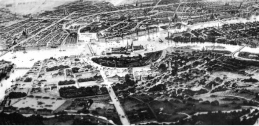
Städte sind für Historiker Dokumente sui generis . In ihnen laufen die Lebenslinien von Abertausenden, manchmal von Millionen von Menschen zusammen. Panorama St. Petersburgs aus den 1860er Jahren. Lithographie von A. Appert (nach einer Zeichnung von J.J. Charlemagne).

Städte sind Helden sui generis , Subjekte aus eigener Kraft und Machtvollkommenheit, aber an ihnen lässt jeder Herrscher, der etwas auf sich hält, seinen Willen und seine Machtvollkommenheit aus. So werden sie von ihm geschmückt und von ihm gezeichnet. Manche Epochen haben dafür gesorgt, dass ganze historische Schichten aus dem Antlitz der Städte getilgt wurden und verschwunden sind. Man braucht einen Aussichtspunkt, um Städte überblicken zu können, aber ihr Geheimnis erschließt sich doch erst, wenn man sich ins »Dickicht der Städte« begibt.