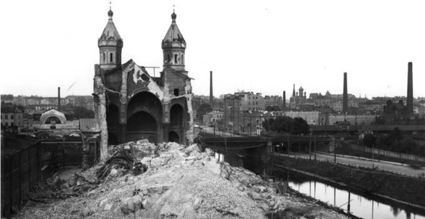
Städte sind wie ein aufgeschlagenes Buch der Geschichte, in dem wir nur zu lesen verstehen müssen. In ihnen kristallisieren sich Epochen, historische Brüche hinterlassen ihre Spuren und Narben. Abriss der Kirche des heiligen Märtyrers Miron am Obwodnyj Kanal in den 1930er Jahren.