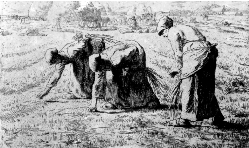
Abb. 3: Ährenleserinnen, Radierung von Jean-François Millet, 1857.

Wie diese Kinder wanderten alljährlich ganze Gruppen von Frauen, gleichfalls meist aus dem südlichen Vorarlberg, zur Zeit der Getreideernte bis nach Biberach und Kempten, um für einige Wochen als „Ährenleserinnen“ die nach dem Einbringen der Ernte liegengebliebenen Halme aufzusammeln. 85