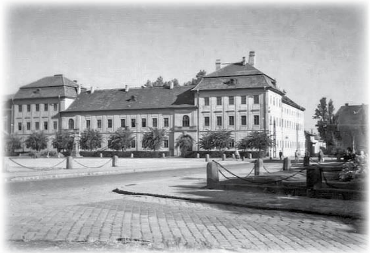
A váci Sztáron Sándor gimnázium 1956-ban

Sőt ekkor már tudtam a „sorok között is olvasni”. Könnyű volt észrevenni a kommunista propaganda és a valóság közötti ellentétet. Az államosítások és az ezekkel járó gazdasági romlás, az alapvető iparcikkek hiánya, a határok teljes lezárása, a külföldi újságok betiltása, a „vasfüggöny” mögötti bezártság csak fokozták az emberek bizalmatlanságát a rendszerrel szemben.