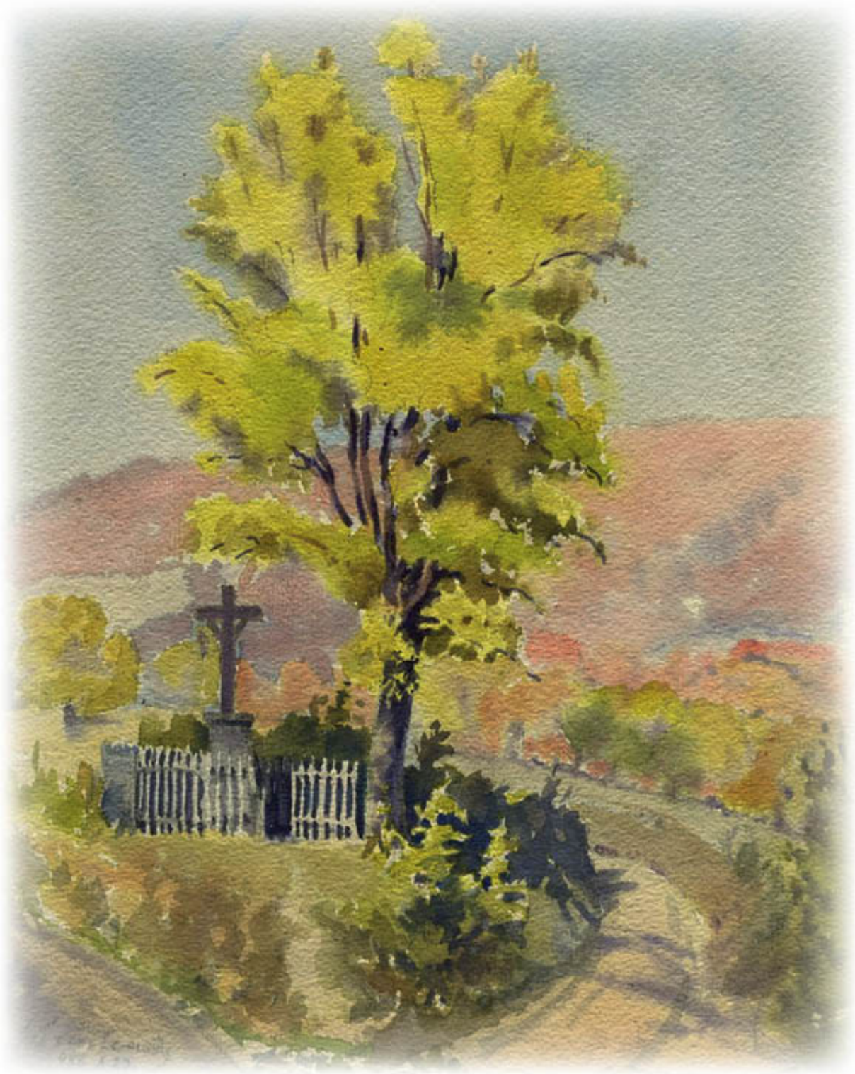
Keresztút a Naszály felé, Apu akvarellje, 1956. október 23-án készült.