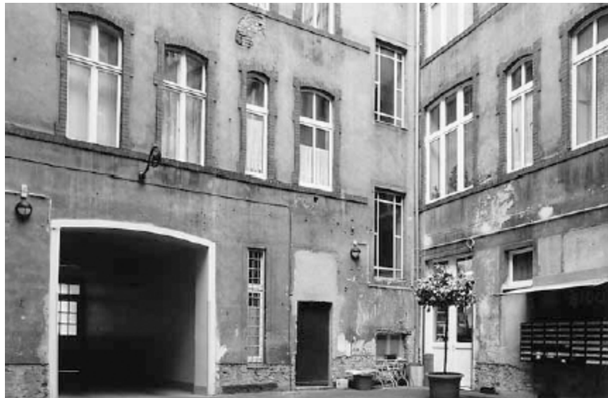
Hinterhof Ackerstraße 6/7

Unter unserer Wohnung in der Ackerstraße wohnte ein Ehepaar, und die Frau ging auf den Strich. Wir Kinder zählten immer die Herren und passten auf, wie lange sie sich bei der Dame des Hauses aufhielten. Einmal gab es einen furchtbaren Krach. Sie hatte einen Mann sehr lange bei sich. Der Ehemann kam nach Hause, und wahrscheinlich aus Eifersucht ging er mit der Axt auf den Liebhaber los. Er schlug vor der Wohnungstür auf ihn ein. Noch Monate danach sah man einen großen Blutfleck an der Wand im Treppenflur.