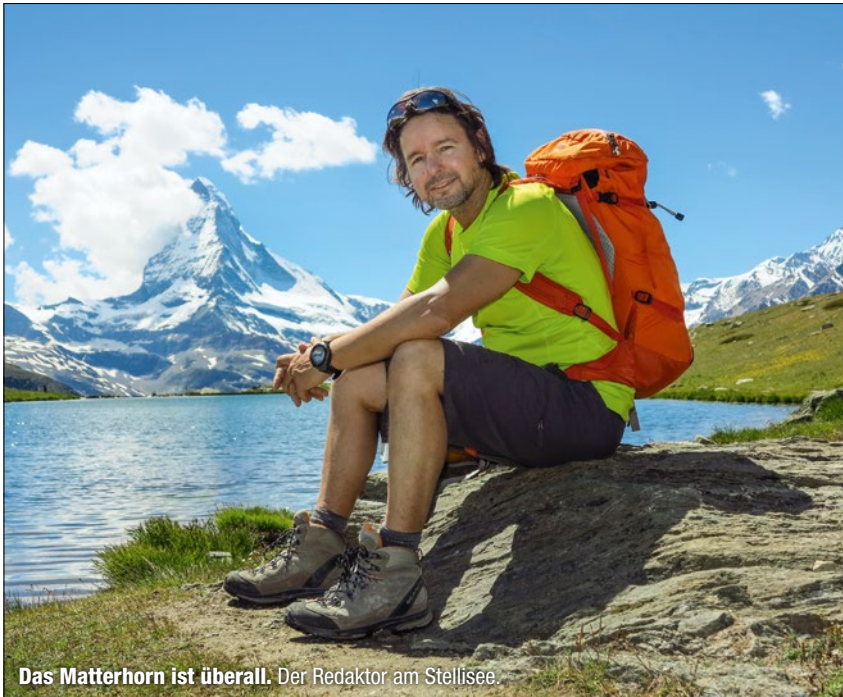
Das Matterhorn ist überall. Der Redaktor am Stellisee.

Edward Whymper und Jean-Antoine Carrel. Zwei Männer, deren Namen untrennbar mit dem Matterhorn verbunden sind. Zwei Männer, die immer an die Besteigung des als unbezwingbar geltenden Berges glaubten – und ihn oft gemeinsam berannten. «Carrel hat den Glauben und die Zuversicht, Whymper den Ehrgeiz, als Erster auf dem Scheitel dieses letzten, unerreichten Alpengipfels zu stehen. Was war näherliegend für beide, als sich zu verbünden?», schrieb schon Luis Trenker in seinem Buch «Helden der Berge».