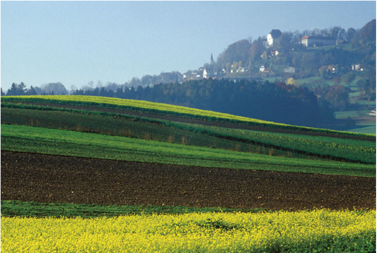
Blick auf Wolfsegg am Hausruck

Besuch beim Hirsch in Wolfsegg (Brandlhof), wo Hedi oft in der Küche aushalf