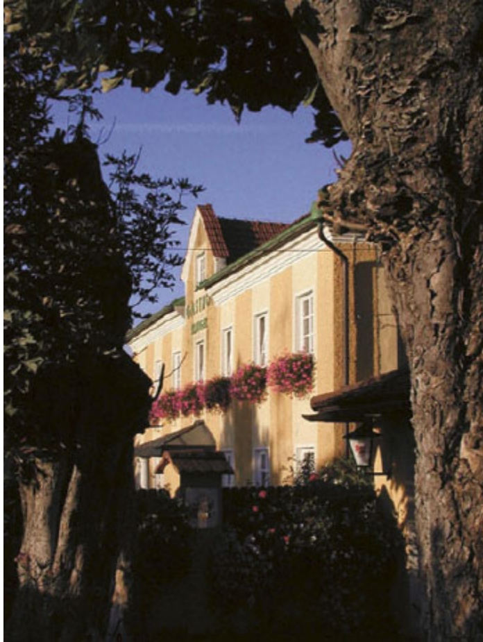
Der Gasthof Klinger vom Gastgarten aus gesehen