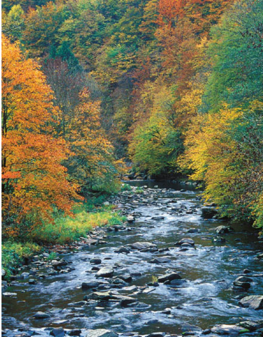
Die Aschach im oberösterreichischen Naturschutzgebiet Steinwand