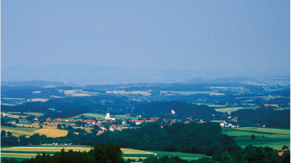
Blick auf Gaspolthofen, rechts der weiße Silo der Klingerermühle

1951 lernte meine Mutter in der ländlichen Hauswirtschaftsschule in Weyregg am Attersee nicht nur viele praktische Fertigkeiten vom Melken bis zum Schafescheren, sondern auch ganz ausgezeichnet kochen. 1956 heiratete sie meinen Vater, der damals auch ein kleines Transportunternehmen führte, und zog zu ihm nach Gaspolthofen. In den folgenden acht Jahren kamen vier Kinder. Der Gasthof Klinger wurde zeitweise verpachtet, bis meine Eltern ihn 1980 nach einem großen Umbau und substanziellen Investitionen definitiv selbst führten.