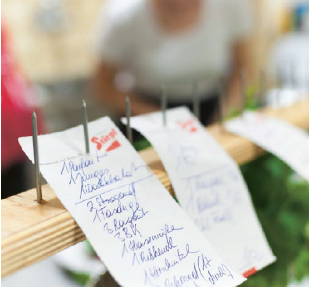
Hochbetrieb in der Klinger-Küche

Schweinsbraten, Schnitzel und oft auch Wildgerichte. Manch einsame Schenke lief bei solchen Gelegenheiten zu kulinarischer Hochform auf.