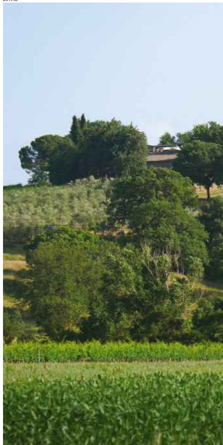
☒ Landgut bei Cinigiano in der Provinz Grosseto