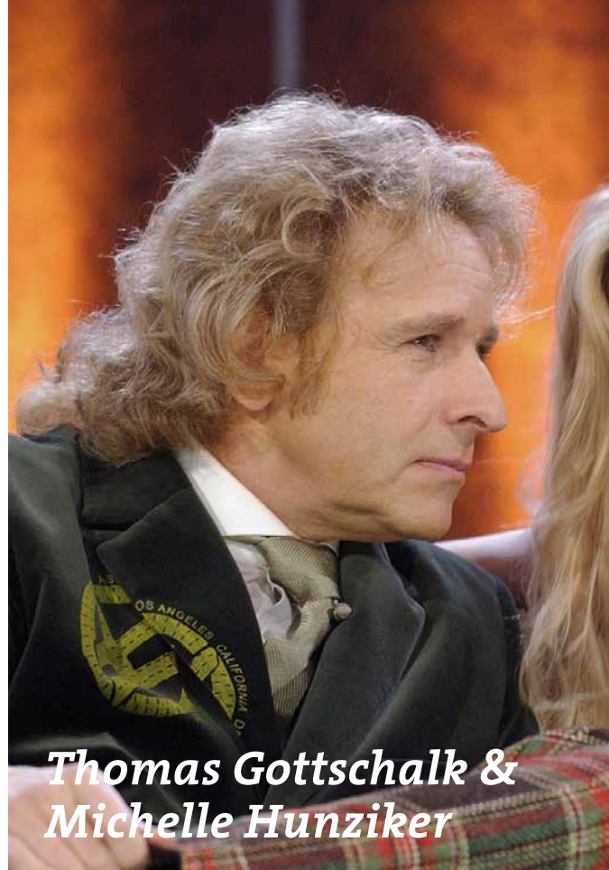
Thomas Gottschalk & Michelle Hunziker