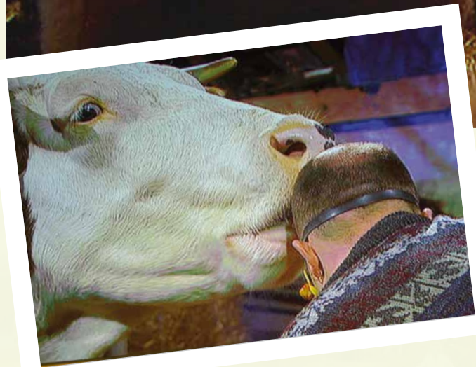
Der »Moggi-Achim« und seine Viecher. »Moggi« ist übrigens das schwäbische Wort für »Kuh«.