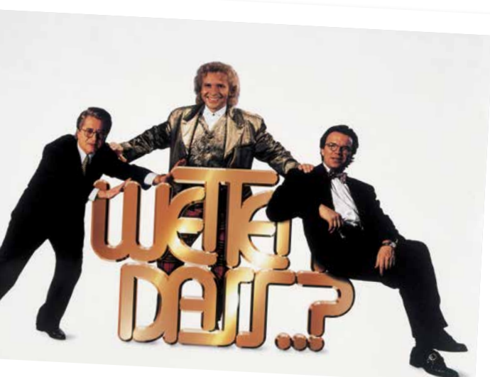
Frank Elstner, Thomas Gottschalk, Wolfgang Lippert. Letzterer moderierte die Show nur neunmal. Er sprang ein, als Gottschalk in den Jahren 92 bis 94 eine Auszeit nahm.