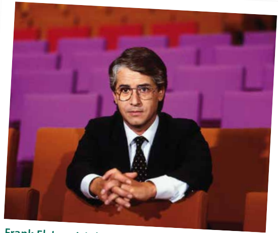
Frank Elstner ist der Erfinder von Wetten, dass..? Monate suchte er nach einer Idee, schließlich fiel ihm die Show am Küchentisch ein ein.

»Es war eine Zeit, in der jeder neue Konzepte und ich eine neue Herausforderung suchte«, erzählt Frank Elstner. Denn nach neun Jahren als Programmdirektor von Radio Luxemburg und sechs Jahren als Moderator der Montagsmaler stand er am Scheideweg: Fernsehen oder Radio? »Beides zusammen ging nicht.« Als Dieter Stolte, damals designierter Intendant des ZDF, ihn fragte, ob er nicht eine Idee für eine große Show habe, sah er darin ein Zeichen: »Ich habe beschlossen beruflich erst mal gar nichts zu machen und