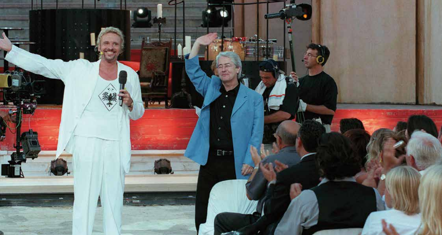
Das erste Sommerspecial auf Mallorca. Frank Elstner sitzt im Publikum. Was man dem grinsenden Gottschalk nicht ansieht: Er hat einen Bandscheibenvorfall, wurde erst Minuten vorher »gesund gespritzt«

kenes Auto bergen und sagte zu der damals schon gereiften, für viele aber noch als Schönheitsidol geltenden Schauspielerin Zsa Zsa Gabor: »Das Auto, das Sie da gerade sehen, hat dreißig Jahre im Wasser gelegen. Da würden sogar Sie Schaden nehmen, gnädige Frau.« Mitunter übertrieb er es auch. 1986 rief er einer 61-jährigen Artistin nach ihrem Auftritt auf dem Weg in die Kulisse hinterher: »Nun ziehen Sie sich aber schnell was an, in diesem Alter erkältet man sich leicht die Eierstöcke.« »Stopp, Thommy!« und »Skandal bei Na sowas« waren nur zwei der harmloseren Schlagzeilen, die dieser Scherz nach sich zog. Deutschland war empört. Und so jemand sollte die mit großem Abstand beliebteste Fernsehshow Deutschlands moderieren? War sich Elstner wirklich bewusst, wen er da ins Boot holte?