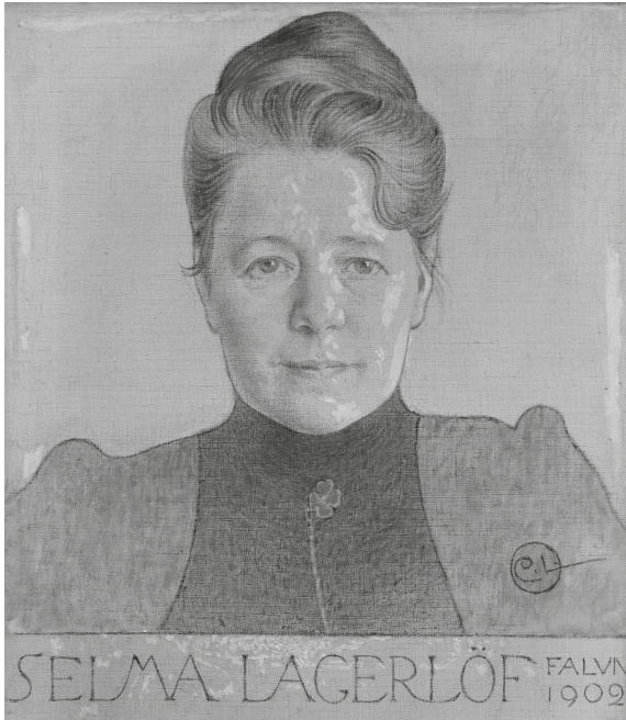
Carl Larsson: Die Schriftstellerin Selma Lagerlöf , 1902, Kreide und Öl