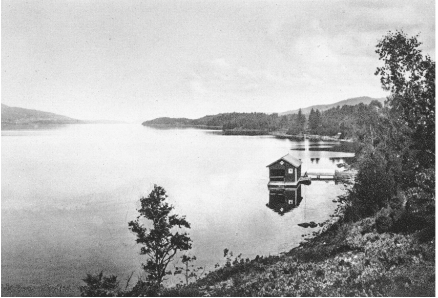
Landschaft in Värmland, Anfang 20. Jahrhundert