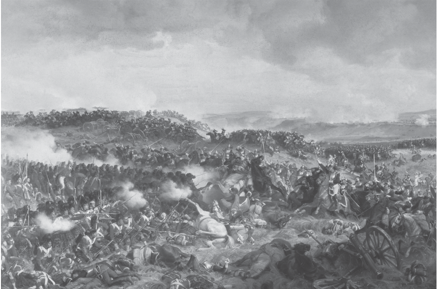
So dachte sich das spätere 19. Jahrhundert Napoleons letzten Kampf: "Die Schlacht von Waterloo". Gemälde, 1874, von Felix Philippoteaux (1815–84).