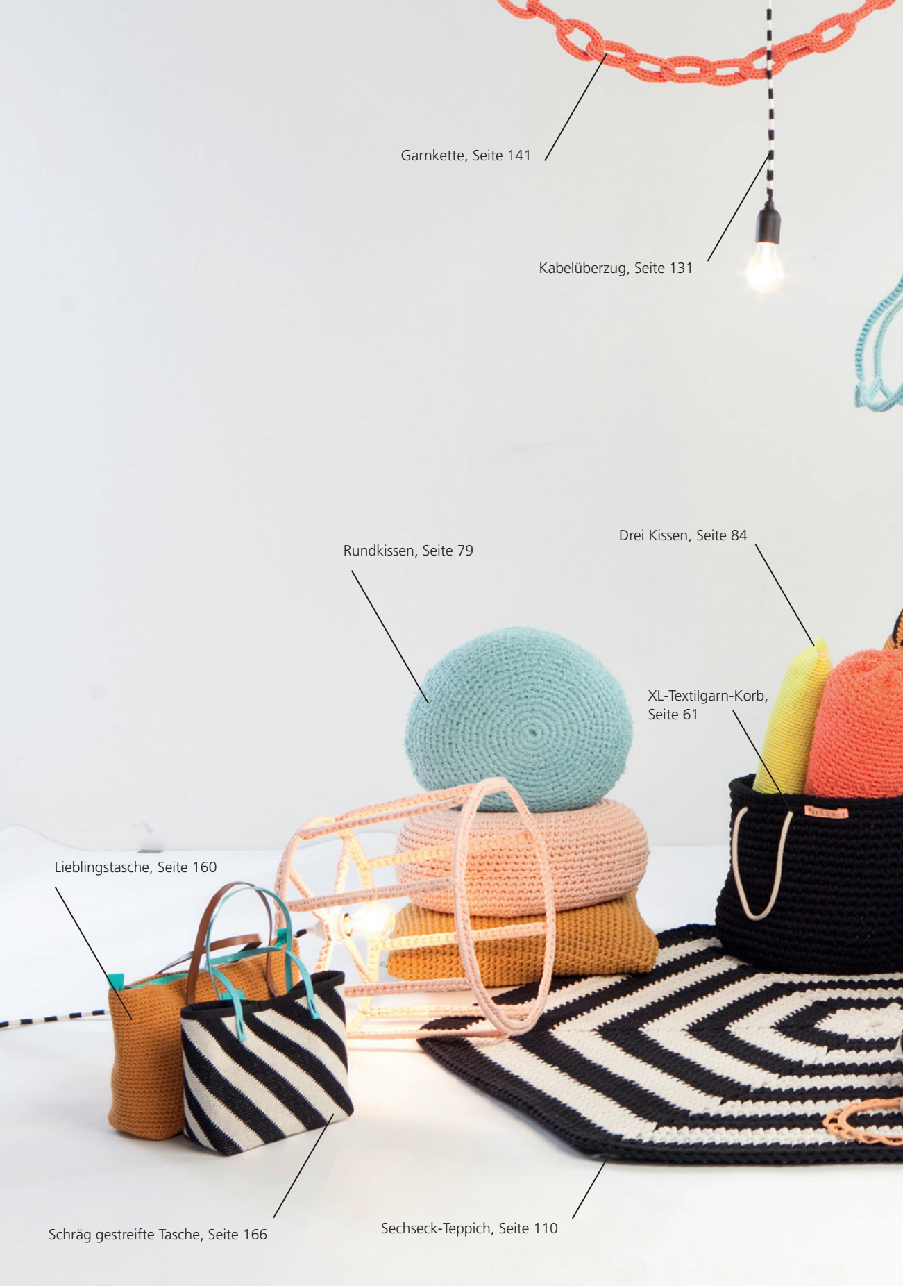
Garnkette, Seite 141