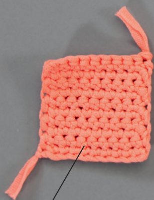
Baumwoll-Schlauchgarn (Lauflänge 60 m/50 g)