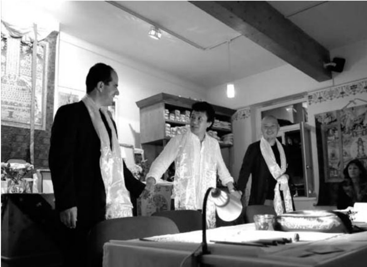
Kunst schlägt Brücken, Ausstellung im Tibethaus „Kalligraphie im Dialog“