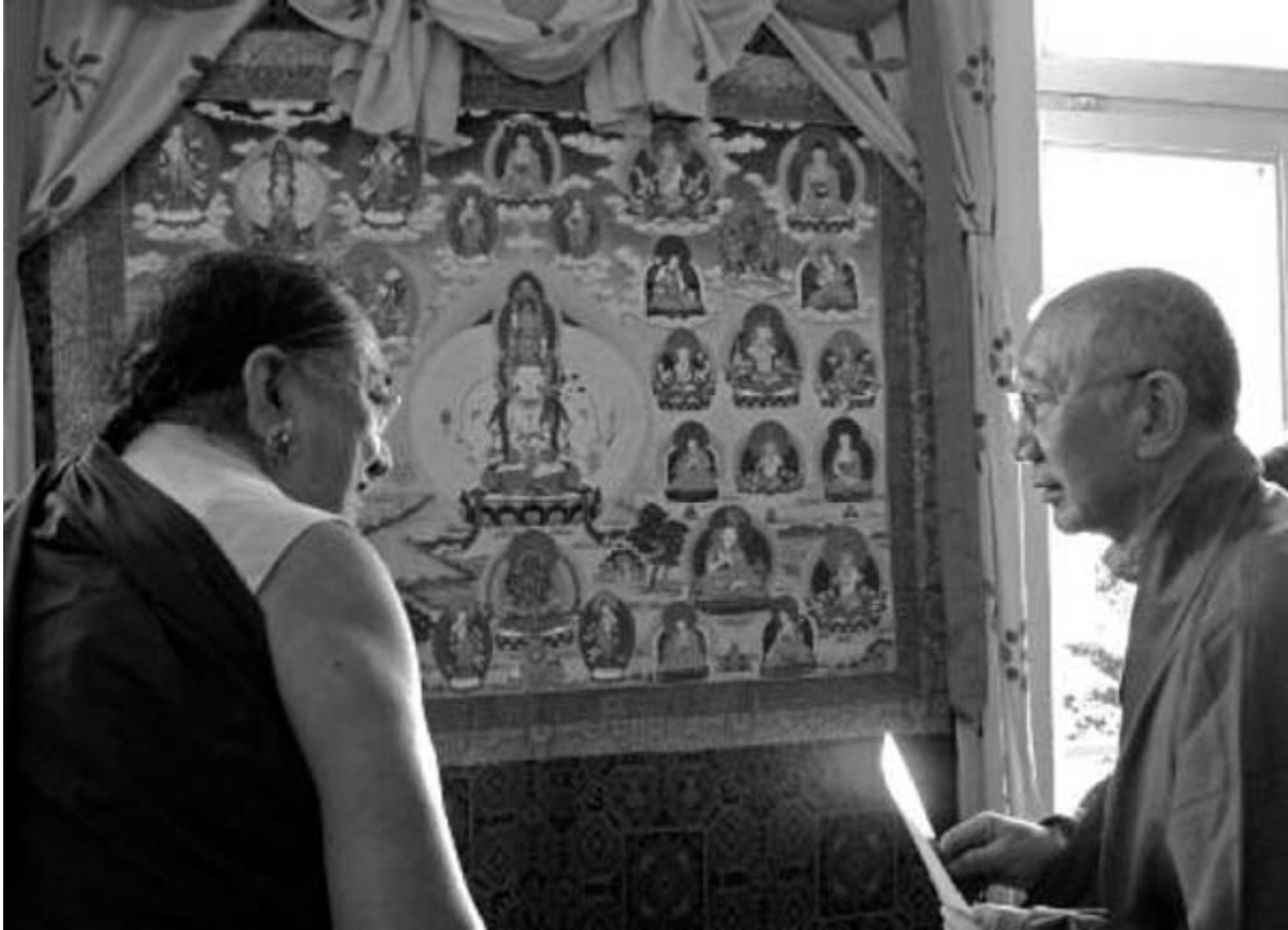
S.H. Sakya Trizin im Gespräch mit S.E. Dargyab Rinpoche

Die Kontaktadressen aller Bereichsleiter/innen finden sich im Serviceteil des Journals.