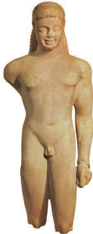
16. Anonym. Kouros , Asclepieion, Paros, ca. 540 v.Chr. Marmor, H: 103 cm. Musée du Louvre, Paris (Frankreich). Griechische Antike.