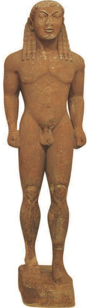
4. Anonym. Kleobis und Biton , Apollo Sanctuary, Delphi (Griechenland), ca. 610-580 v.Chr. Marmor, H: 218 cm. Archaeological Museum of Delphi, Delphi (Griechenland). Griechische Antike. (*)