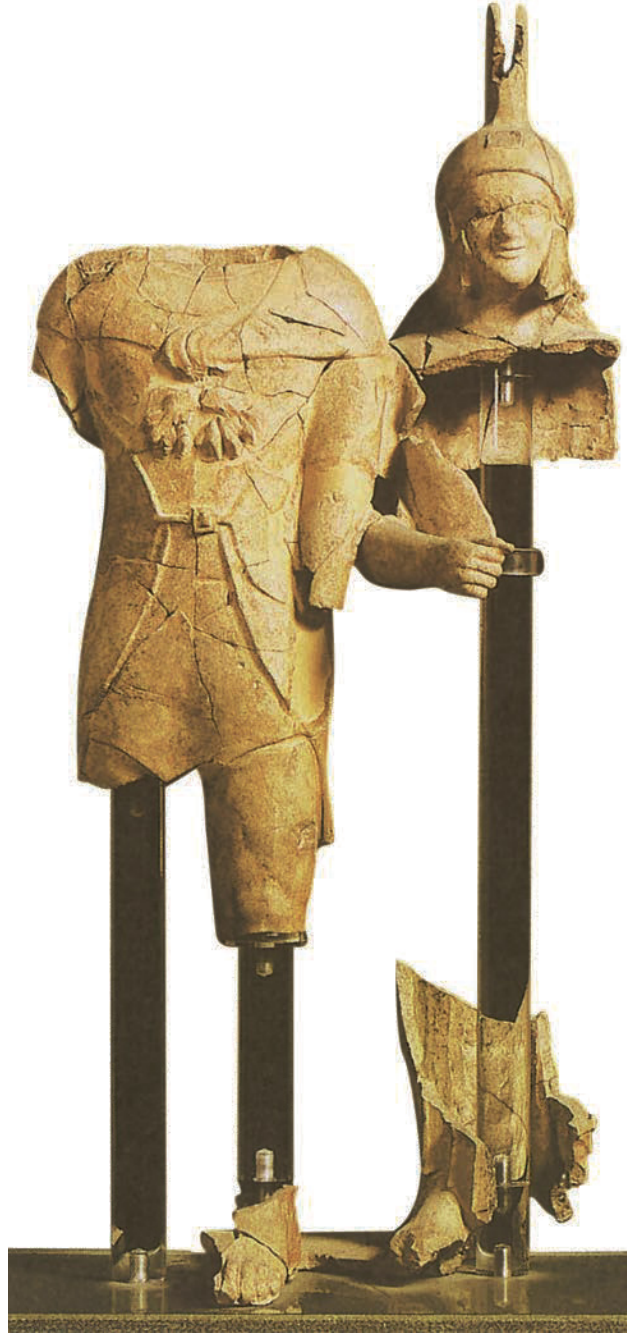
23. Anonym. Athena zeigt Herakles den Olymp , 530-520 v.Chr. Terrakotta. Museo Nazionale Etrusco di Villa Giulia, Rom (Italien). Etruskische Antike.