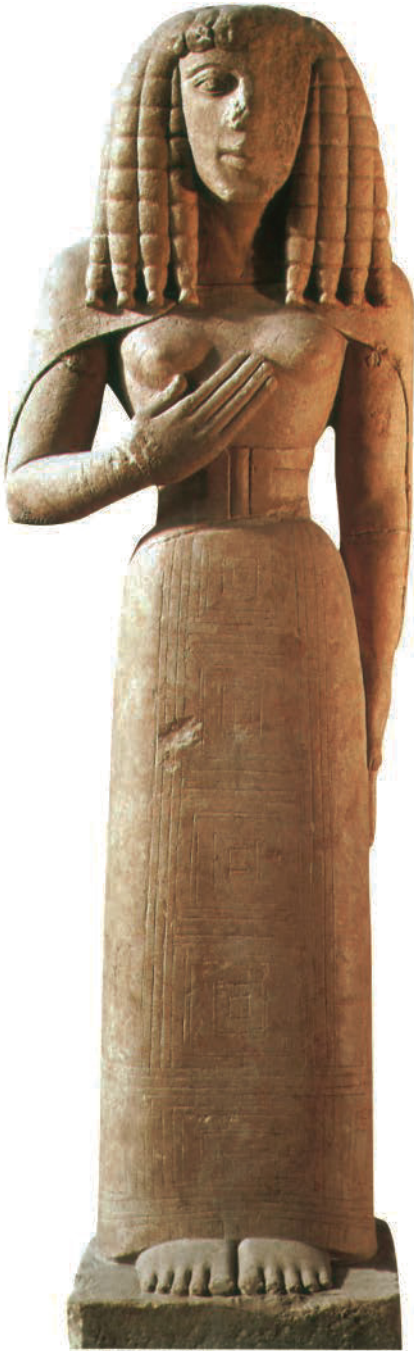
3. Anonym. „Kore von Auxerre”, ca. 640-630 v.Chr. Kalkstein, H: 75 cm. Musée du Louvre, Paris (Frankreich). Griechische Antike. (*)