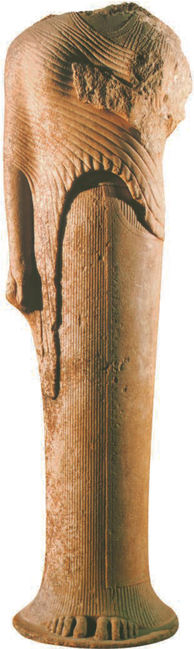
9. Anonym. Kore, der Hera gewidmet, von Cherymyes von Samos, ca. 570-560 v.Chr. Marmor, H: 192 cm. Musée du Louvre, Paris (Frankreich). Griechische Antike. (*)