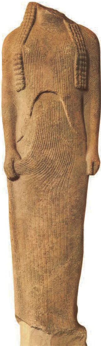
10. Anonym. Ornith, Geneleos-Gruppe, Heraion von Samos, Samos (Griechenland), ca. 560-550 v.Chr. Marmor, H: 168 cm. Staatliche Museen zu Berlin, Berlin (Deutschland). Griechische Antike.