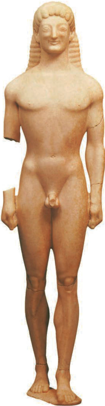
14. Anonym. Kouros genannt „ Apollo von Tenea “, ca. 560-550 v.Chr. Marmor, H: 153 cm. Glyptothek, München (Deutschland). Griechische Antike.