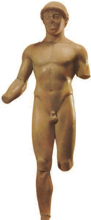
18. Anonym. Kouros, Agrigento, ca. 500-480 v.Chr. Marmor, H: 104 cm. Archaeological Museum, Agrigento (Italien). Griechische Antike.