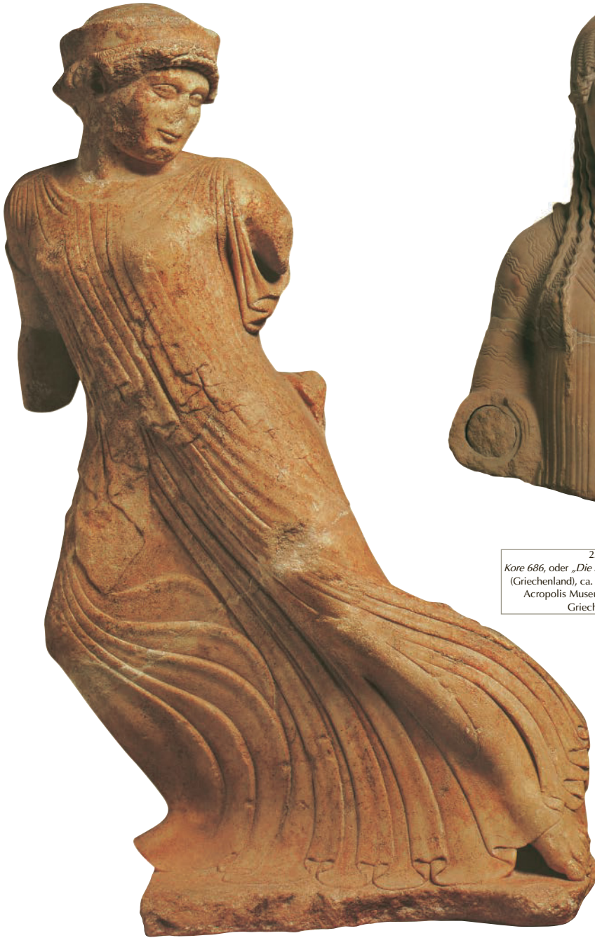
24. Anonym. Junges laufendes Mädchen , Giebel, Eleusis-Tempel, Eleusis (Griechenland), ca. 490-480 v.Chr. Marmor, H: 65 cm. Archaeological Museum, Eleusis (Griechenland). Griechische Antike.