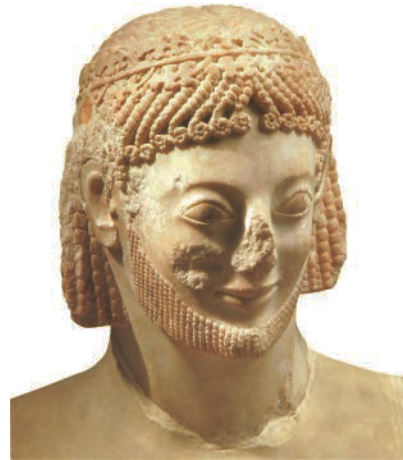
15. Anonym. Kopf eines Reiters genannt der „ Reiter Rampin “, Akropolis, Athen (Griechenland), ca. 550 v.Chr. Marmor mit Farbspuren, H: 27 cm. Musée du Louvre, Paris (Frankreich). Griechische Antike. (*)