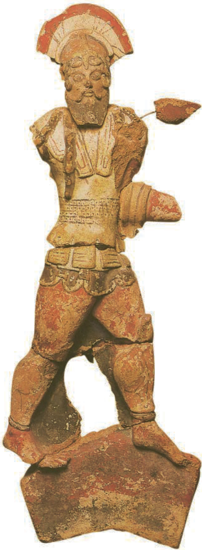
22. Anonym. Krieger aus Cerveteri , 530-510 v.Chr. Terrakotta. Ny Carlsber Glyptotek, Kopenhagen (Dänemark). Etruskische Antike.