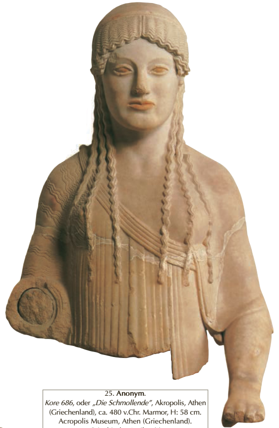
25. Anonym. Kore 686 , oder „ Die Schmollende “, Akropolis, Athen (Griechenland), ca. 480 v.Chr. Marmor, H: 58 cm. Acropolis Museum, Athen (Griechenland). Griechische Antike. (*)