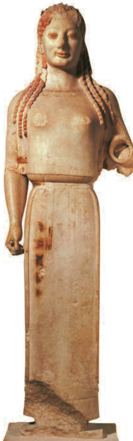
12. Anonym. Kore 679, oder „Peplos Kore“, Akropolis, Athen (Griechenland), ca. 530 v.Chr. Marmor mit Farbspuren, H: 118 cm. Acropolis Museum, Athen (Griechenland). Griechische Antike. (*)