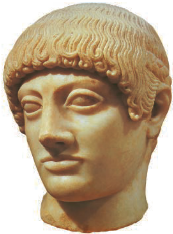
17. Anonym. Kopf eines blonden Jünglings, Asclepieion, Paros, ca. 485 v.Chr. Marmor, H: 25 cm. Acropolis Museum, Athen (Griechenland). Griechische Antike.