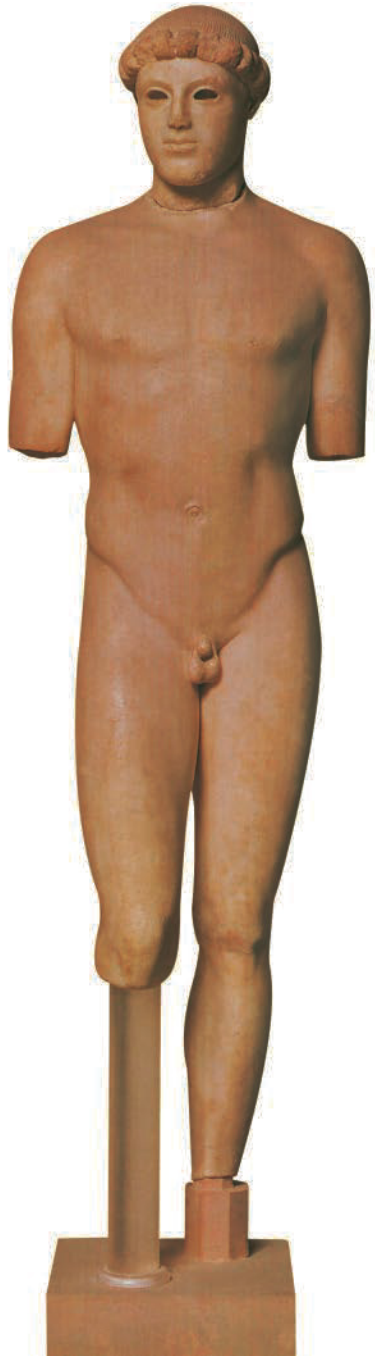
19. Anonym. Kritios-Knabe, Akropolis, Athen (Griechenland), ca. 480-470 v.Chr. Marmor, H: 116 cm. Acropolis Museum, Athen (Griechenland). Griechische Antike.