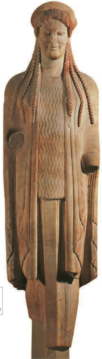
13. Anonym. Kore 671, Akropolis, Athen (Griechenland), ca. 520 v.Chr. Marmor, H: 177 cm. Acropolis Museum, Athen (Griechenland). Griechische Antike.