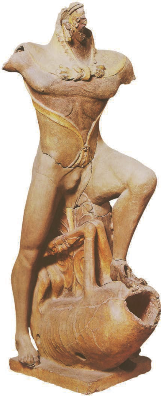
20. Anonym. Herakles , Tempel von Portonaccio, Veji (Italien), 510-490 v.Chr. Terrakotta. Museo Nazionale Etrusco di Villa Giulia, Rom (Italien). Etruskische Antike. (*)