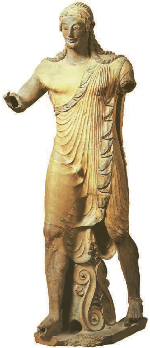
21. Anonym. Apollo , Tempel von Portonaccio, Veji (Italien), ca. 510 v.Chr. Terrakotta, H: 180 cm. Museo Nazionale Etrusco di Villa Giulia, Rom (Italien). Etruskische Antike.