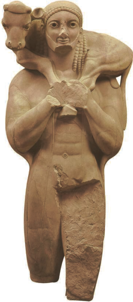
5. Anonym. Moschophoros , oder „Kalbträger“, Akropolis, Athen (Griechenland), ca. 570 v.Chr. Marmor, H: 164 cm. Acropolis Museum, Athen (Griechenland). Griechische Antike.