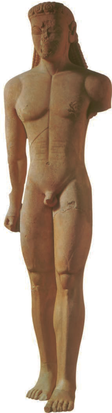
6. Anonym. Sounion Kouros , Poseidon-Tempel, Kap Sounion (Griechenland), ca. 600 v.Chr. Marmor, H: 305 cm. National Archaeological Museum of Athens, Athen (Griechenland). Griechische Antike.