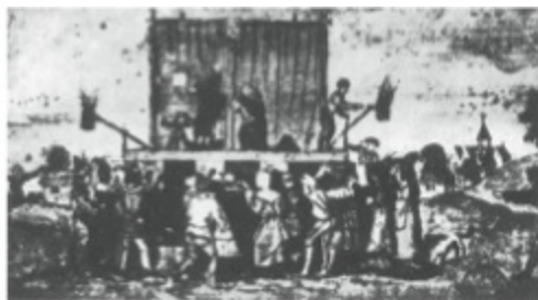
4. «Cómicos ambulantes del siglo XIV». Cambrai, Bibliothèque Municipale.

Siguiendo con las diapositivas, esta imagen nos muestra otra representación sacra, esta vez dramática y grotesca al mismo tiempo.