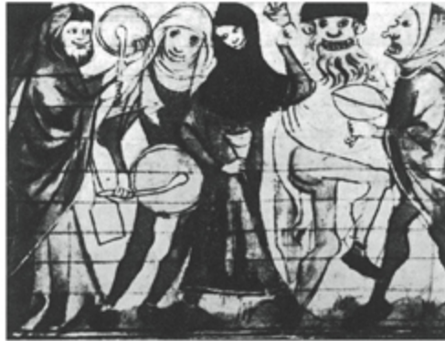
2. Secuencia de una bufonada.

Esta era gente del pueblo... la véis... este va disfrazado de mammuttones . ¿Qué es el mammuttones ? Es una máscara antiquísima, mitad cabra mitad diablo. Aún hoy, en Cerdeña, en algunas fiestas los campesinos se visten con estas extrañas pieles, se cuelgan estos cencerros y se pasean con máscaras muy parecidas a las de la imagen. Veréis que casi todos son diablos. Este es un juglar, este es el personaje del Jolly , el loco (alegoría del pueblo) y este es otro diablo... otro más... he aquí otra secuencia.