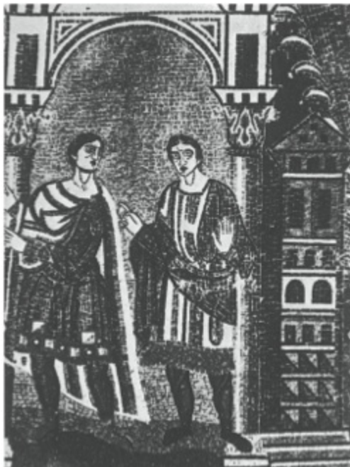
3. Milites , Mosaico absidal (siglo XII). Basílica de San Ambrosio, Milán.

Ocurría que empezaba: «Mis queridos fieles, yo aquí, humilde pastor, os tr...», y todos muertos de risa. «El corderito...», «¡Beeeee!», y el pobre, avergonzado, tenía que marcharse.