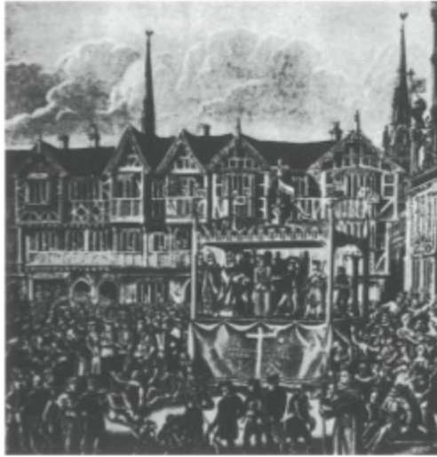
6. Una «Pasión» representada en la plaza del Louvre, en París (siglo XV).

actor que interpreta el papel de Jesucristo, y otros actores. Aquí está Poncio Pilatos con la palangana preparada para lavarse las manos, y aquí vemos a dos obispos, fijos, son dos obispos católicos. Deberían por lo menos llevar ropas hebraicas, ¿no?, con elementos completamente diferentes: sombreros redondos, adornos, trajes de otra época, completamente distintos, que la gente conocía.