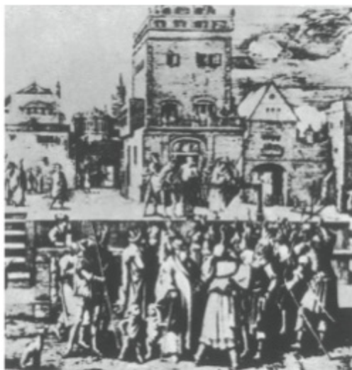
5. Representación cómico-grotesca en la plaza municipal de Amberes (1465).

¿Y qué dice el pregonero? Grita: «¿A quién queréis en la cruz?».