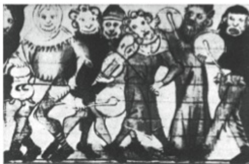
1. Secuencia de una bufonada.

Por eso en la Edad Media mataban con tanta abundancia a los juglares, los desollaban, les cortaban la lengua, por no hablar de otros adornos. Pero volvamos al auténtico «misterio bufo».