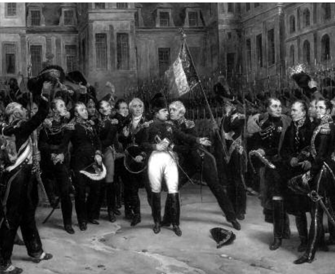
Napoleon I. verabschiedet die Kaiserliche Garde am 20. April 1814 im Hof des Schlosses von Fontainebleau. Gemälde von Antoine Alphonse Montfort nach einer Vorlage von Horace Vernet.