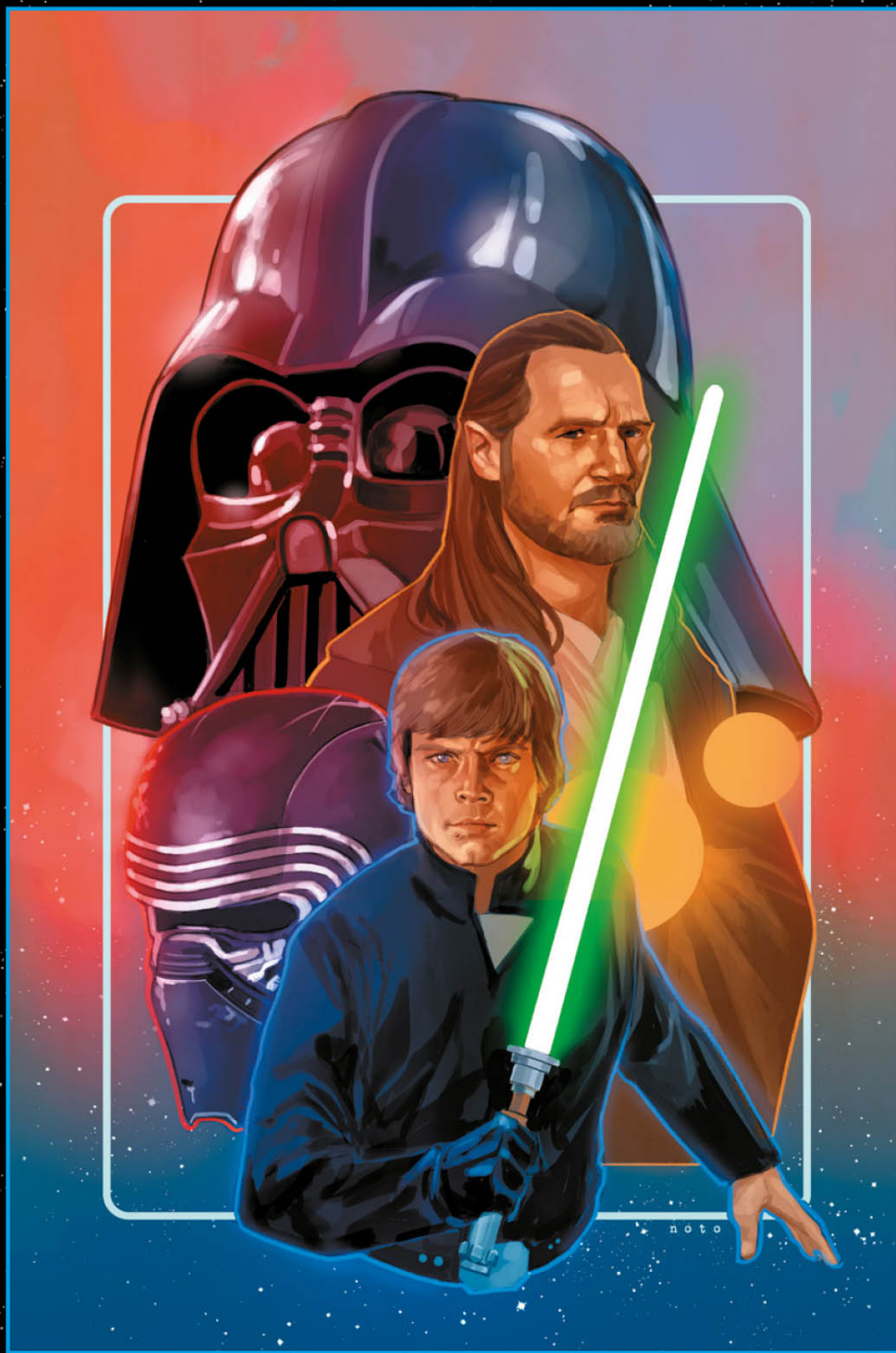
Cover von PHIL NOTO für US-FREE COMIC BOOK DAY 2025: STAR WARS (2025) #1