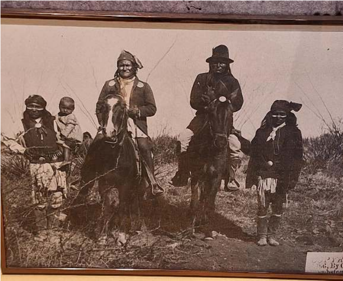
Abbildung 19: Geronimo zu Pferd, begleitet von seinen besten Kriegern kurz vor der Kapitulation