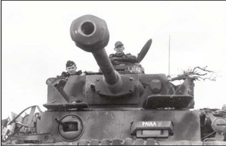
Angehörige des Panzerregiments der "Hitlerjugend"- Division.