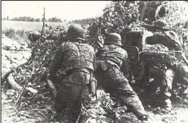
Eine 7,5-cm-Pak im Abwehrkampf in der Normandie.