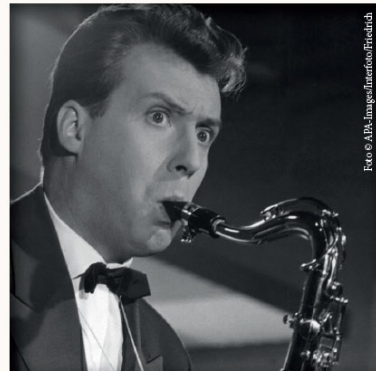
Charme, Schmah und Saxophon.