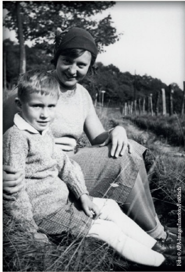
Peter Alexander mit seiner Mutter.