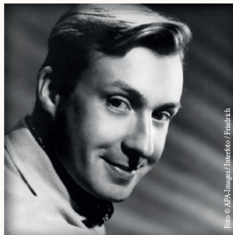
1950: Das junge Talent.